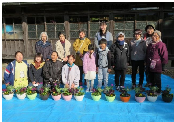
(田代自治会 12月21日(土))