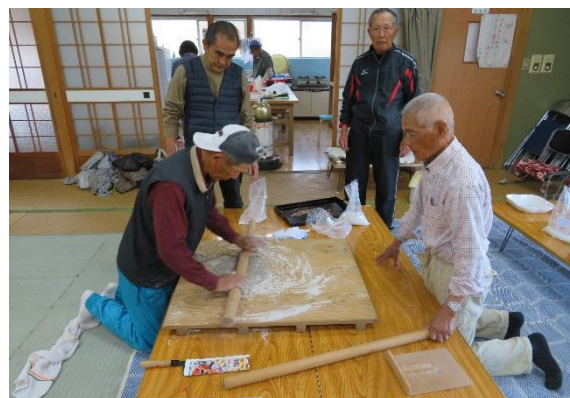
(3) そば打ち(西上江自治会)

各自治会の公民館において、女性部等の方が参加して花の寄せ植え及び生け花教室が行われました。寄せ植えは、ビオラ・葉ボタン・ナデシコを、生け花は松・千両・菊等の素材を使って行われ、それぞれの素材の特徴を活かした作品ができ上がり正月に華をそえられました。