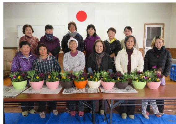
(西上江自治会 12月26日(木))