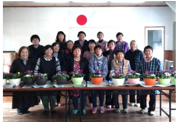
(西上江自治会 12月26日(金))