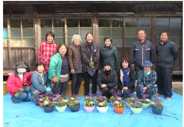
(田代自治会 12月21日(日))