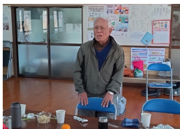
(4) クリスマス会 (池島自治会)

各自治会の公民館において、女性部等の方が参加して花の寄せ植え及び生け花教室が行われました。花の寄せ植えは、ビオラ・葉ボタン・シクラメン等の5種類の花を植えました。生け花は、松・千両・菊等の素材を使って行われ、それぞれの素材の特徴を活かした作品ができ上がり正月に華をそえられました。