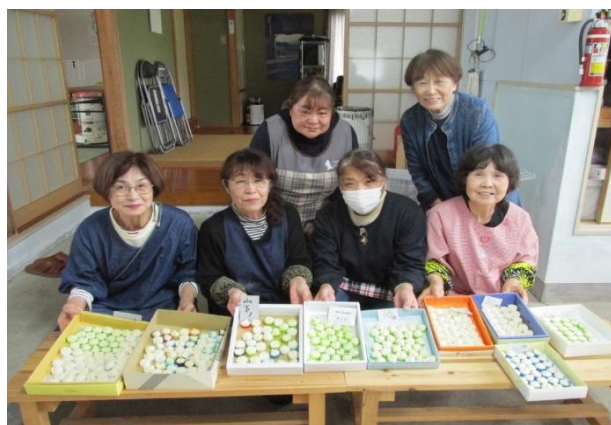
[東長江浦下自治会の皆さん]