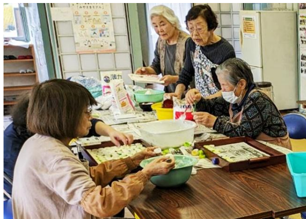
[松原自治会の皆さん]