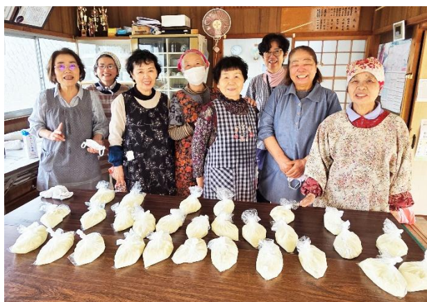
[前松原自治会の皆さん]