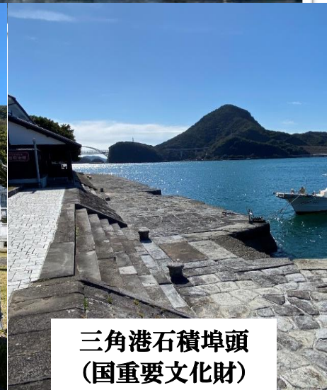
三角港石積埠頭 (国重要文化財)