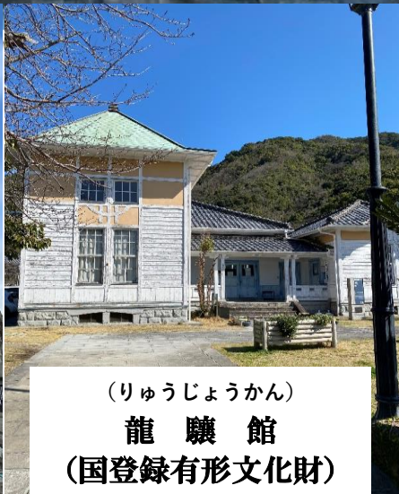
(りゅうじょうかん) 龍驥館 (国登録有形文化財)