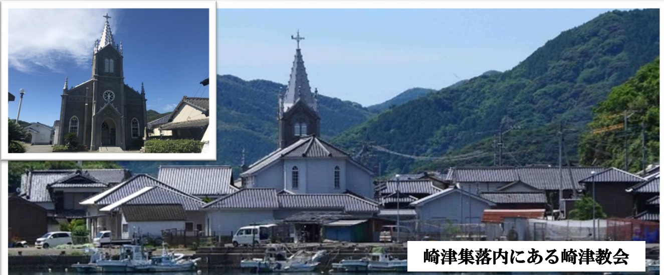
崎津集落内にある崎津教会

「三角西港」は九州有数の貿易港として栄え、特に三池炭鉱の石炭を輸出した港として、『明治日本の産業革命遺産 製鉄・製鋼・造船・石炭産業』の構成遺産として世界遺産に登録されました。明治期の港が完全に残るのは、日本でここだけだそうです。