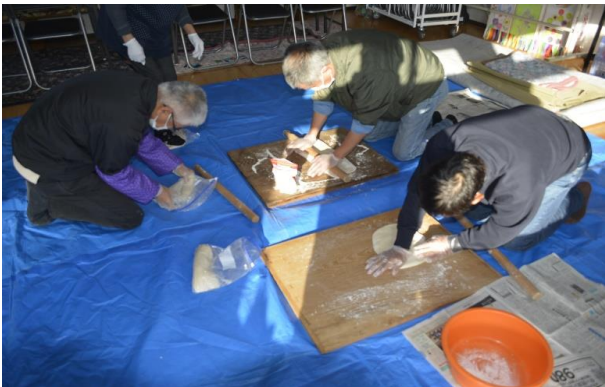
上原田自治会（郷土料理教室：うどん作成）