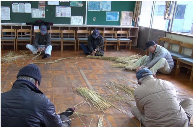
上大河平自治会（しめ縄作り）