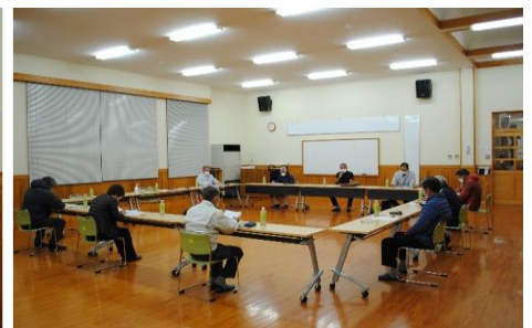
挨拶をする地主会長及び市民協働課長