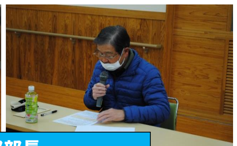
本年度の事業報告をする各専門部部長