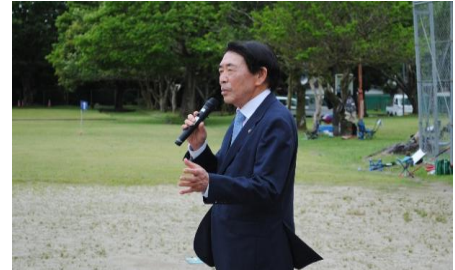
市長が激励に来てくださいました。