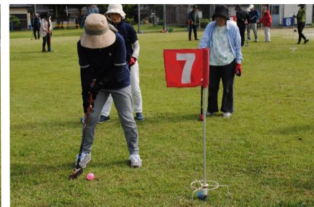
ホールインワンが全部で12個でした。