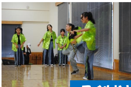
ワイルドキャッツ