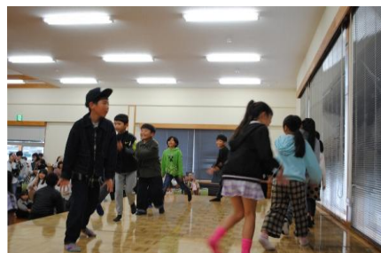
飯野小「えびの音頭」