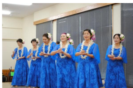
歌謡フラ・アロハえびの