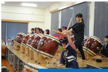
西小林保育園園児による和太鼓