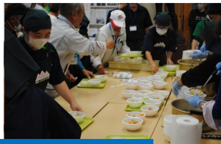
振る舞いの配食と食事風景