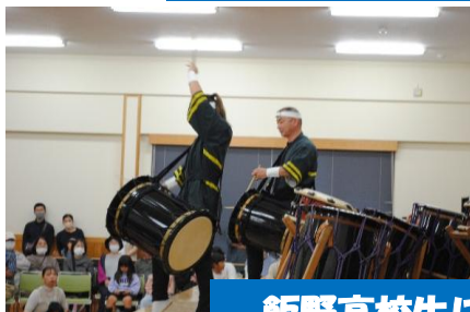
飯野高校生による和太鼓