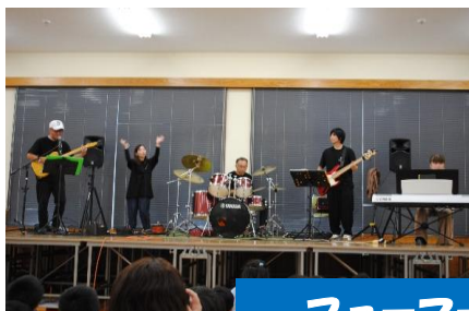
ファームスバンド 「Komeno0T0」