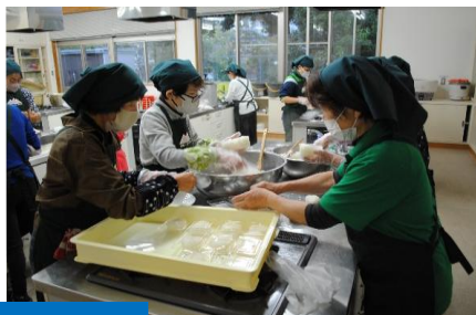
豚汁600人分 おにぎり900個作成