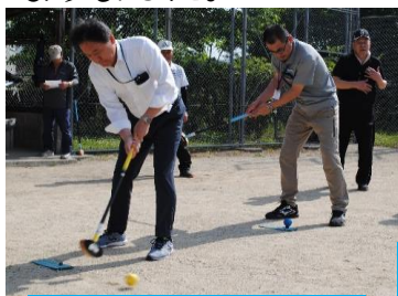
来賓による始球式

参加者は、山麓会主催の今年度最初の大会に、大いに喜び大いに楽しんだ1日になりました。