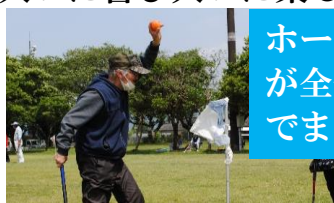
ホールインワン が全部で15個 でした。