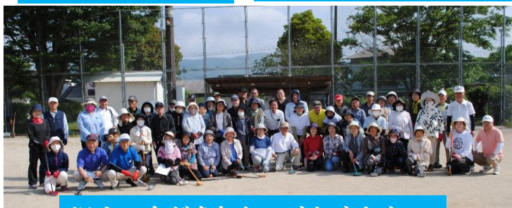
沢山の方が参加してくれました。