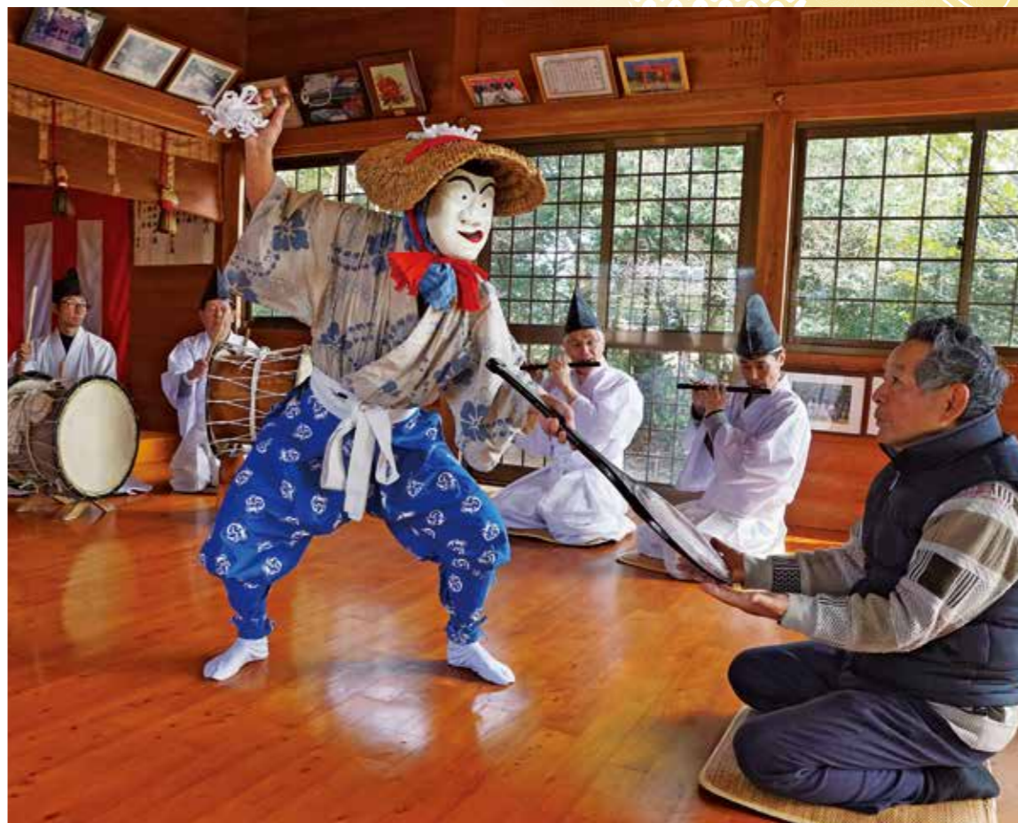
田の神舞は、田の神に感謝するとともに、伊勢の天照大御神・豊受大神に謝意を述べ舞い納める