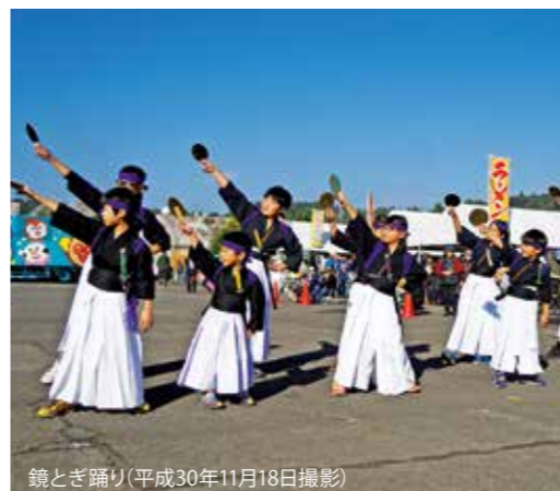
鏡とき踊り(平成30年11月18日撮影)

えびの市の郷土芸能は、個性的で魅力的なものばかりです。令和4年度も産業文化祭や芸能まつりで市民の皆さんに披露する計画です。これからも工夫して多くの人に親しんでもらえるような取り組みを行っていきまので、皆さんのご理解と協力をお願いします。