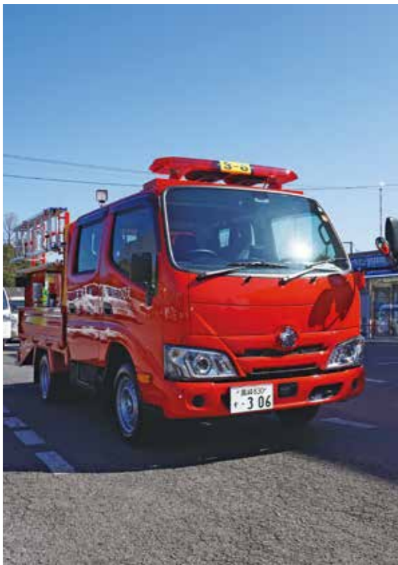
更新された第3分団第6部の消防車両

えびの市消防団第3分団第6部(西内堅・北岡松・南岡松)の消防車両1台が更新され、2月24日に市役所で引渡式が行われました。更新された消防車両は小型動力ポンプ付積載車です。導入費用の約4分の1を県の地域消防防災活動支援事業費補助金を活用して更新されました。導入費用は748万円です。市では、消防団の消防車両を古いものから順に更新しています。引渡式で、えびの市消防団の川