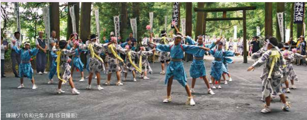
鎌踊り(令和元年7月15日撮影)

「御田踊り」とも呼ばれる鎌踊り。今から約2千年前、薩摩の国隼人で、百姓が五穀豊穡を祈願し踊ったのが始まり