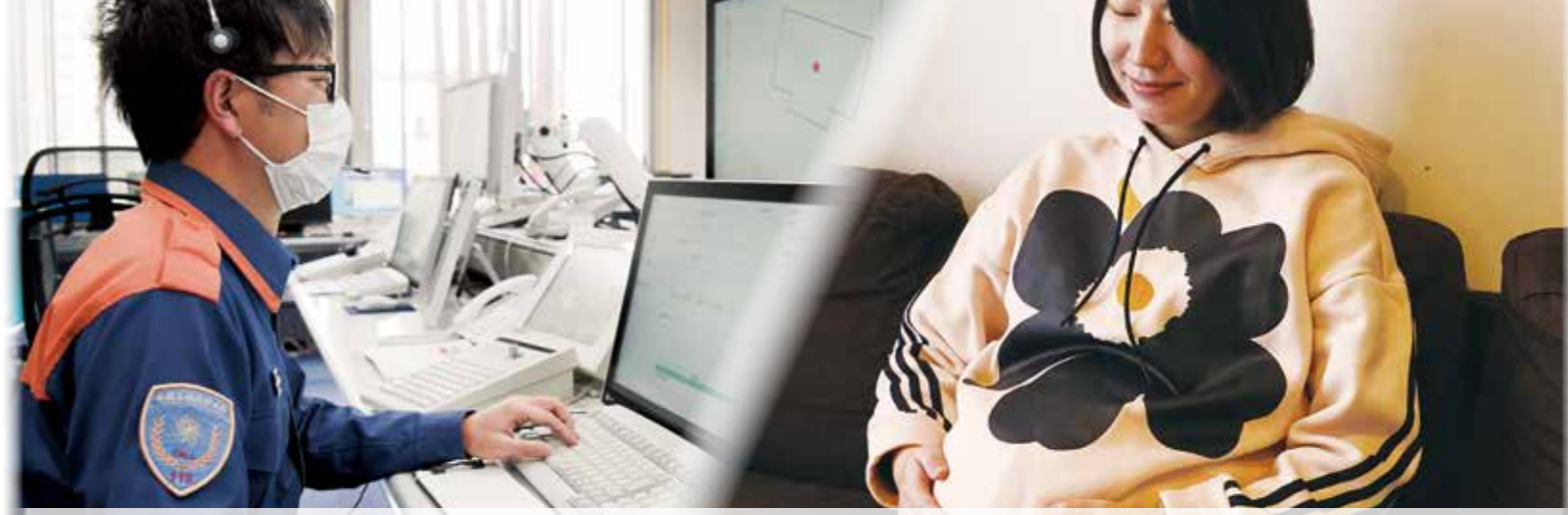
西諸地域で出産予定の妊婦の不安などを軽減するため、令和3年12月から緊急を要する場合に、妊婦を救急車で産院などに搬送する「出産サポート119」が始まりました。