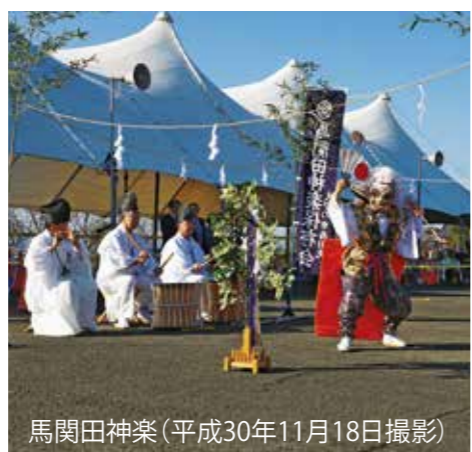
馬関田神楽(平成30年11月18日撮影)