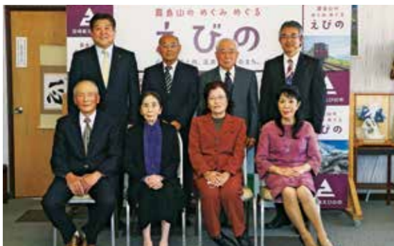
表彰式には、6人が出席しました