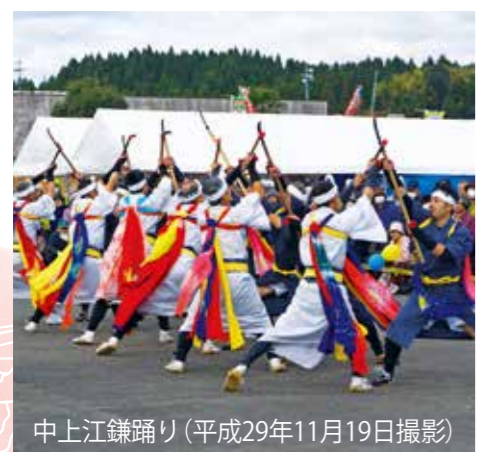
中上江鎌踊り(平成29年11月19日撮影)