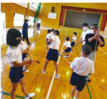
保存会の人々が数人来て、学校の体育館で踊りの細かな指導をします

「地域の人はとても楽しみにしてくれています。何より、児童が誇りをもって取り組んでいます。自分たちの踊りで地域の人が喜ぶ姿を見ることで、児