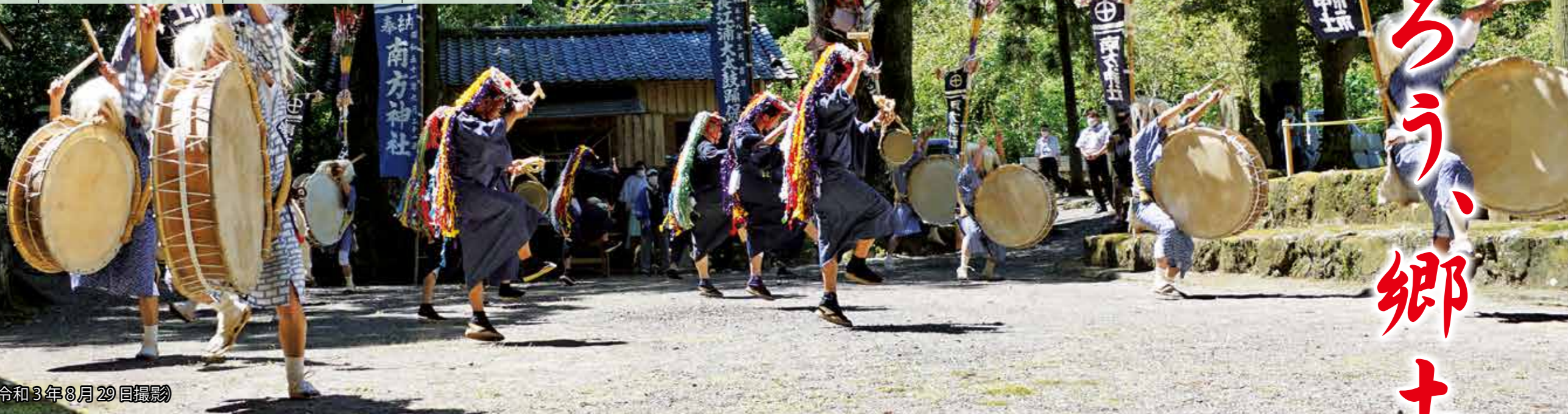
西長江浦の南方神社で踊る大太鼓踊り(令和3年8月29日撮影)