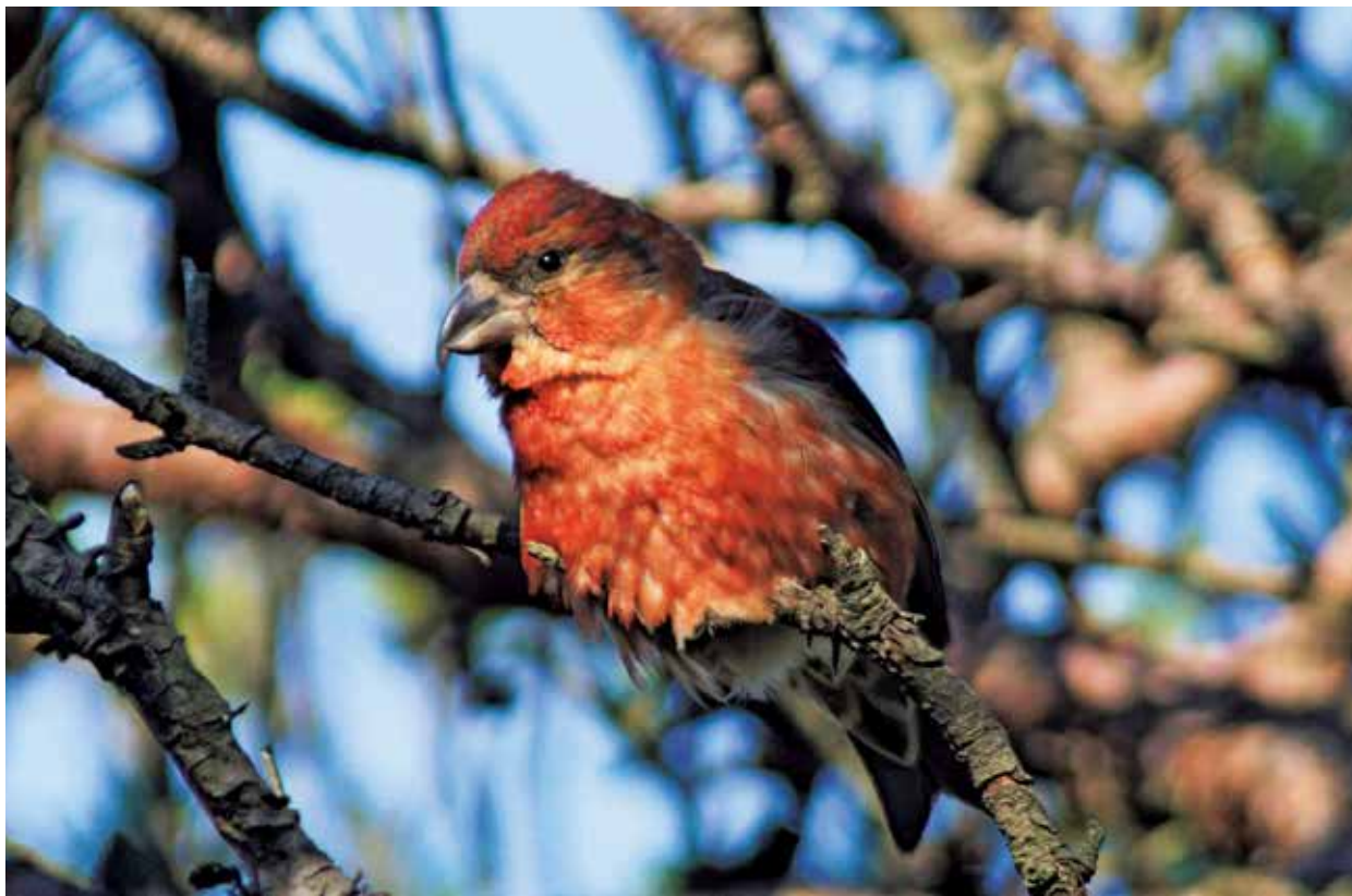
写真：アカマツの梢にとまったイスカ (撮影：令和3年6月23日)