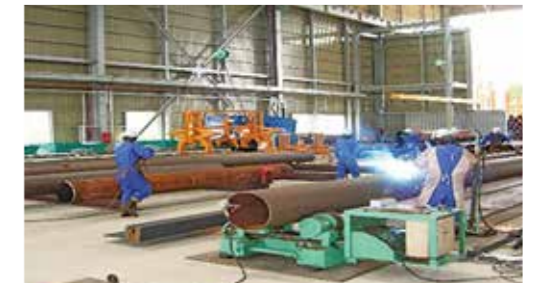
鋼管杭製作加工の状況