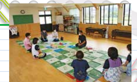
救急法の講習を実施しました

れました。参加者からも「和やかな雰囲気と少しの緊張感の中、大事なことが学べて子育てをする上で少し自信につながった」との声をいただきました。上江保育園家庭教育学級では、子育ての悩みを気軽に相談できて、子どもたちの成長を喜び合い、一緒に成長していける場でありたいと思っています。これから先、どこまで活動範囲を広げられるか分かりませんが、園児、保護者と一緒に楽しめる活動を行ってまいります。