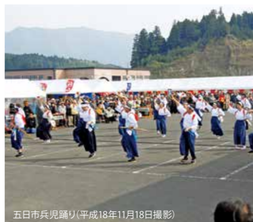
五日市兵児踊り(平成18年11月18日撮影)

新型コロナウイルス感染症の影響で行事が中止になることもあり、地域の語らいの場が少なくなってきました。郷土芸能は、地域とのつながりが生まれる一つの方法です。 自分の住んでいる地区に限らず、えびの市内で興味を持った郷土芸能があれば、参加してみたいかがでしょうか。