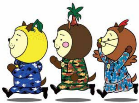
「みやざき犬使用許可280042号」