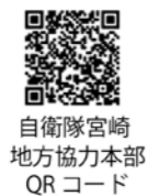
自衛隊宮崎 地方協力本部 QRコード

自衛隊宮崎地方協力本部小林地域事務所では、令和4年度自衛官等各種募集を行います。