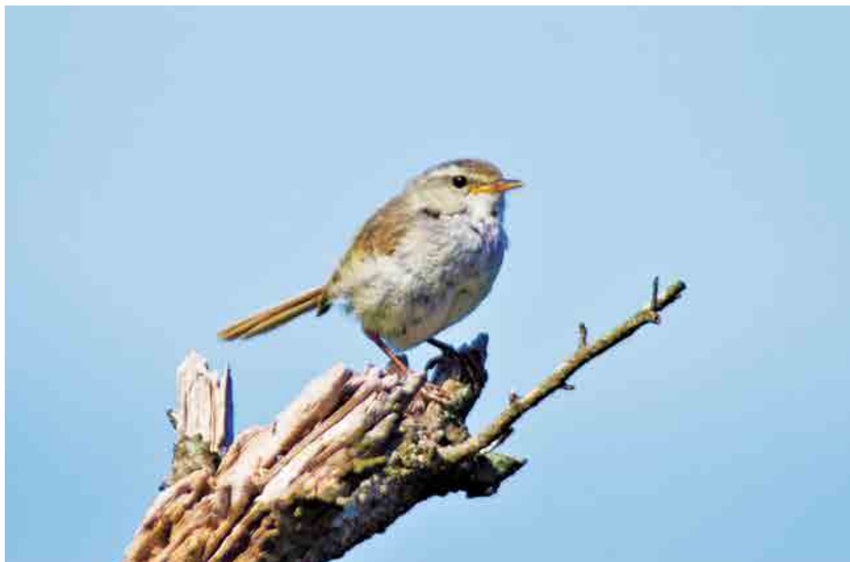
写真：ウグイス (撮影：令和元年6月13日)