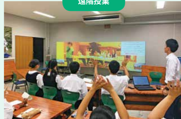
2016年に「つながる教室」を導入してから、島根県隠岐島前高校との交流を続けています。オンラインでさまざまな人と関わることで多様な価値観に触れることができます。

ラオスの学生と交流しました。オンラインでつなぐことで、手軽に他の国のことを知ることができ、現地の学生の様子や文化の違いなどを学ぶこともできました。