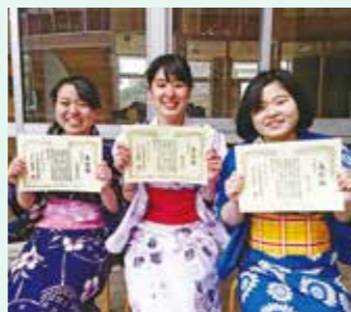
生活文化科では、三冠王を目標に、3つの検定試験での1級合格を目指しています。

ファッションデザイン、フードデザイン、保育、ICTなど、実践を通したさまざまな学びを実施しています。その中から課題テーマを設定し、実践を通して地域や社会に発信することで、生活の豊かさを最大化するにはどのようにしていけばいいのかを考えます。また、手厚い指導により技術を向上させ、検定試験の合格を目指します。