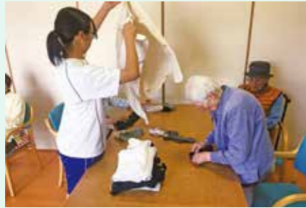
地域貢献活動として、1年間実習を行います。介護施設や飲食店、スーパーなどさまざまな場所で行います。

「1年間の地域キャリア実習」を必修とし、生の現場で自分が決めた課題に向かい、地域の皆さんと協働しながら実践することで、未来を創造する力を育みます。地域貢献活動で総合的な人間力を養い、さまざまな進路を実現させます。