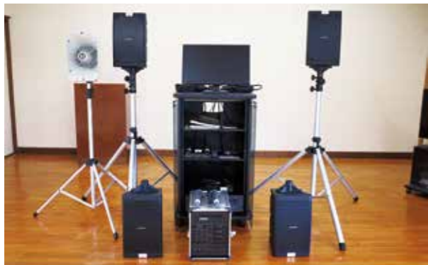
整備された音響設備

一般財団法人自治総合センターの宝くじ助成を活用し、西川北自治会（真幸地区）に音響設備一式が整備されました。 今回整備されたのは、マイク、スピーカー、アンプ、AVオーディオラックなどです。西川北地区の伝統行事や自治会活動などで活用します。