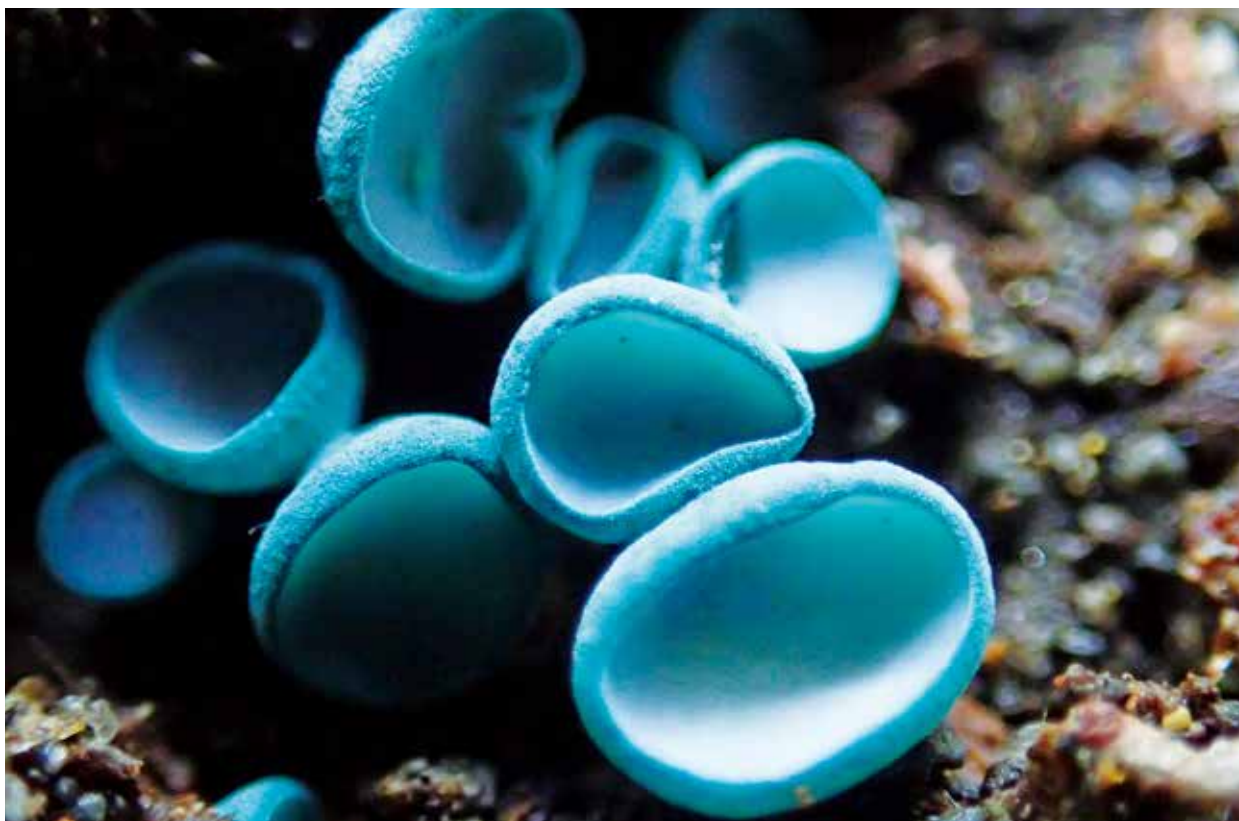
写真：ロクショウグサレキン（撮影：令和元年10月23日）