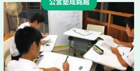
大学などへの進学や企業への就職の希望を実現するため、市が支援し、課外授業などを行っています。