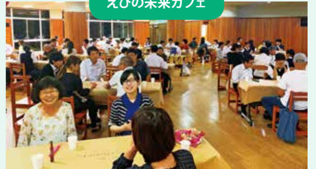
えびの市市民団体連絡会議が行う「えびの未来カフェ」に参加し、さまざまな年代の人と意見を交わしています。ワールドカフェ方式で行っており、幅広い意見を聞くことで多様性を身に付けています。