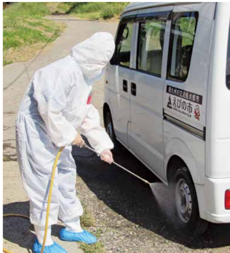
車両の消毒などの防疫の徹底をお願いします

【家畜に異常を見つけたら】家畜に異常（続けて死亡したなど）が確認されたときは、都城家畜保健衛生所または市畜産農政課畜産振興室にご連絡ください。