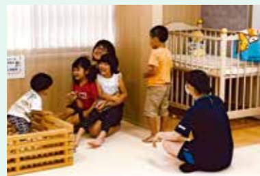
子育て支援サークル「Nogiku」では、えびので子育てがしたいと思ってもらえるようなまちづくりにつなげるため、生徒たちが企画したイベントなどを行っています。

私は「観光甲子園」という大会にエントリーしています。全国の高校生が、外国人に地元をPRする動画を作り、競い合う大会です。さまざまな国や地域の人にえびの市を知ってもらうためにがんばっています。