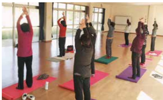
クラブ活動（ヨガ教室）の様子