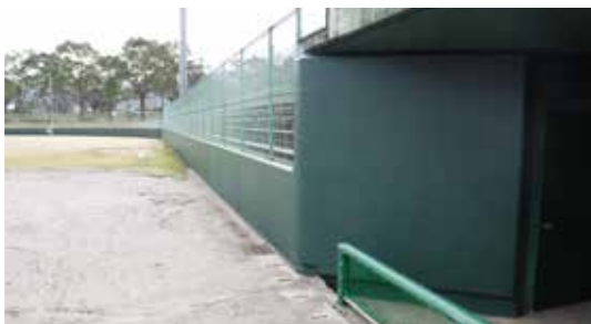
張り替えられたラバーフェンス

市では、王子原運動公園野球場のラバーフェンスの老朽化に伴い、全面張り替えを実施しました。これは、施設開設から25年近く経過し、ラバーフェンスの経年劣化による破損や剥離が進行していたため、利用者の安全性の確保と競技環境の向上を目的として行われたものです。独立行政法人日本スポーツ振興センターのスポーツ振興くじ助成金を活用して整備しました。また、野球場外への飛球も課題となっていたことから、飛球対策として、同助成金を活用し、3月末までに三塁側の防球ネットの新規設置を行います。この助成金は、地域スポーツ活動の活性化を図るため、地方公共団体およびスポーツ団体などが行うスポーツの振興を目的とする事業に対して助成されるもので、スポーツくじ(toto・BIG)の販売で得られた資金が原資となっています。