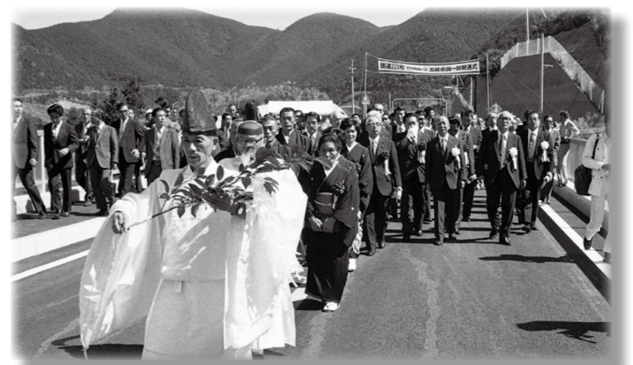
えびのループ開通

9月26日、加久藤中学校グラウンドで、市民体育祭が行われました。これは、合併して10年目を迎えることから、市民が親しく一堂に会することを目的に行われたもので、市民約3千人が参加しました。 (昭和51年10月号掲載)