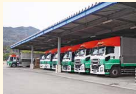
各地へ配送するためのさまざまな種類のトラック