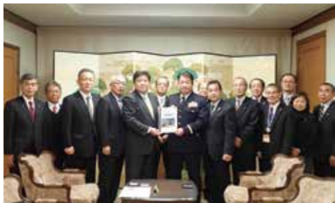
2月に行われた要望会

首長および協議議長やえびの市と湧水町の協力団体の長で構成されている「陸上自衛隊第24普通科連隊・えびの駐屯地存続期成同盟会」による要望活動が実施されました。これは、第24普通科連隊のコア化による大幅な定員削減が過去にあったことにより、さらなる縮小に危機感をもち、始まったものです。平成20年7月の設立以来活動を続け、52回目となった現在、第24普通科連隊の復元やえびの駐屯地の強化および新たな防衛関連施設の整備等に向けて要望を実施しています。