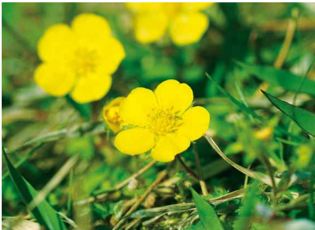
写真:ツルキジムシロ (撮影:平成31年4月21日)