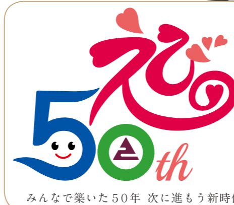
みんなで築いた50年 次に進もう新時代

4月14日、加久藤中学校体育館で「市庁舎新築落成式」が行われ、宮崎県知事など市内外から約800人が出席しました。庁舎落成と同時に市旗・市章も制定され、式典参加者の拍手の中で披露されました。式典後は郷土芸能や民謡、舞踊が披露され、花を添えました。 (昭和49年5月号掲載)