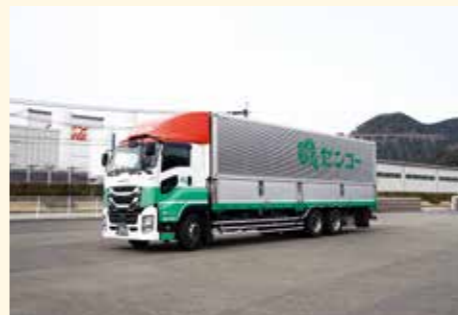
グリーンパークえびの前に事業所があります