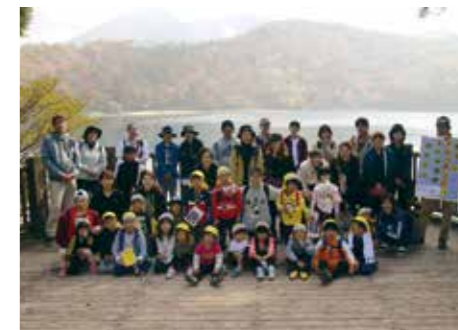
親子でトレッキングを行いました。

活動の中で、育児の不安や、悩みなどの話ができて、さまざまな人の意見を聞きながら、子育てに前向きに出来ました。