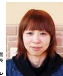
なかよし認定こども園 家庭教育学級長