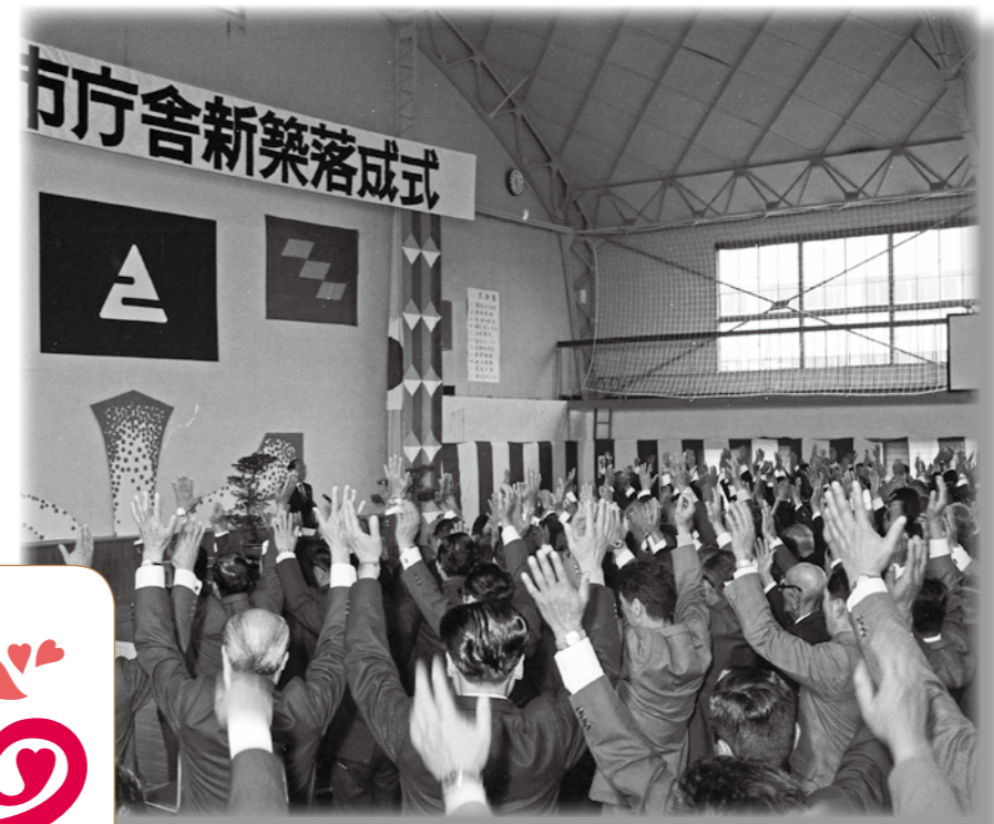
市庁舎盛大に落成式

4月14日、加久藤中学校体育館で「市庁舎新築落成式」が行われ、宮崎県知事など市内外から約800人が出席しました。庁舎落成と同時に市旗・市章も制定され、式典参加者の拍手の中で披露されました。式典後は郷土芸能や民謡、舞踊が披露され、花を添えました。 (昭和49年5月号掲載)