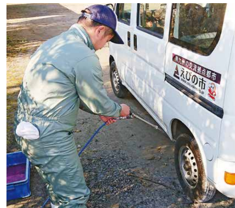
車両などの消毒の徹底をお願いします

国など近隣諸国10カ国に拡大しています。約6200件確認されており、国内への侵入リスクが高まっています(令和元年9月24日現在)。 国内においては平成30年9月9日、平成4年以降発生の無かった豚コレラが岐阜県で確認され、愛知県、長野県、大阪府、滋賀県、三重県、福井県、埼玉県、山梨県へ拡大しています。現在、45事例確認されており、防疫対象頭数は約14万4千頭になっています(令和元年9月23日現在)。 また、野生イノシシの豚コレラ検査状況については岐阜県、愛知県、三重県、福井県、長野県、富山県、石川県、滋賀県で検査頭数4425頭中1201頭で陽性が確認され、ウイルスがまん延しており、県内への侵入リスクが高い状況にあります(令和元年9月20日現在)。 アフリカ豚コレラおよび豚コレラの発生防止のために、野生動物の侵入防止対策、人や車両の消毒等を再度、徹底して行ってください。 【市民の皆さんへ】 家畜伝染病の発生している