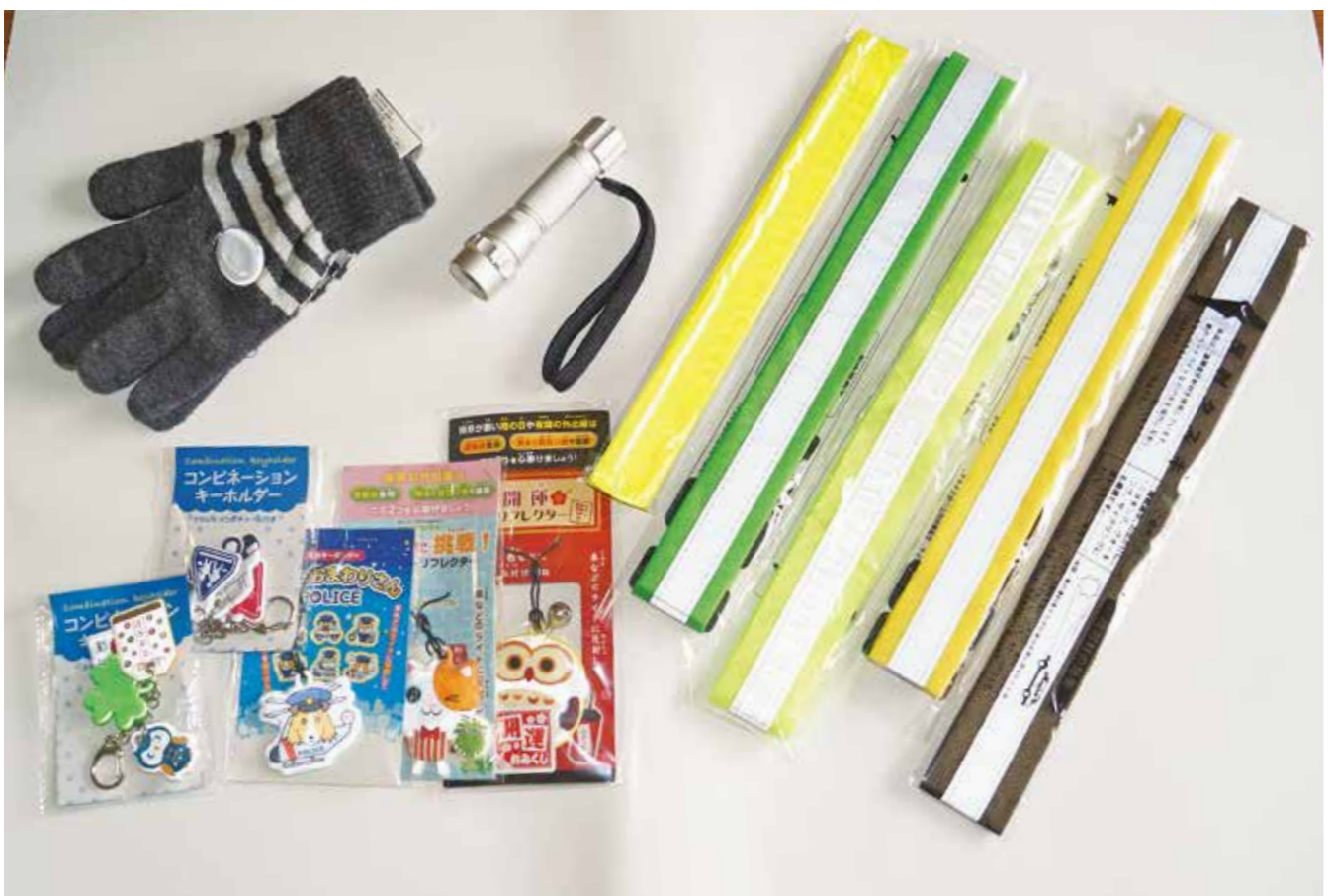
夜間は反射材やライトなどを身に付けて安全に気を付けましょう