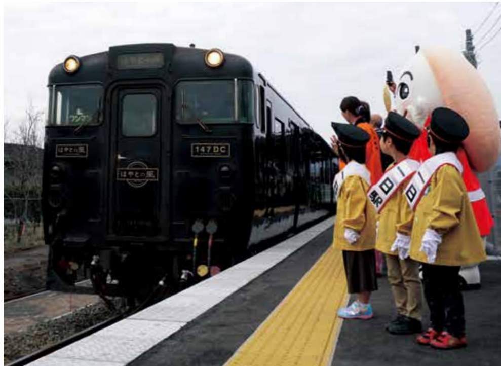
今年の2月に行われた特急はやとの風で行く吉都線観光列車ツアー

市では、特急はやとの風が平日チャーター可能になったことから、市民による観光列車チャーター利用促進のモデル事業として、特急はやとの