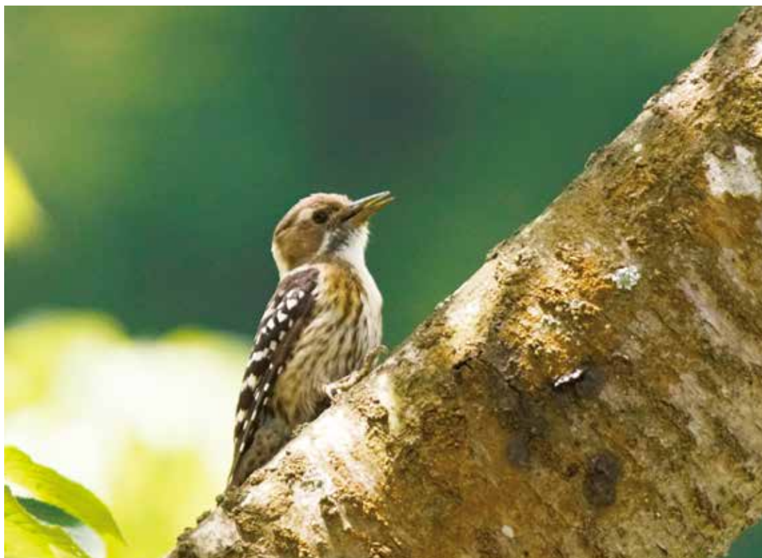
写真:コゲラ (撮影:令和元年5月10日)