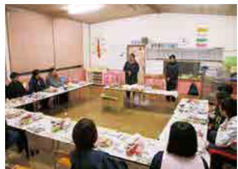
産業文化祭の作品作り（リース作り）の様子

この1年間、さまざまな活動に取り組んできましたが、保護者の皆さんが子どもたちと共に、生き生きとした表情で子育てをしている姿が印象的で、家庭教育学級の必要性を感じました。今年度も残すところわずかとなり、3月の参観日での講演会・開級式のみとなりました。