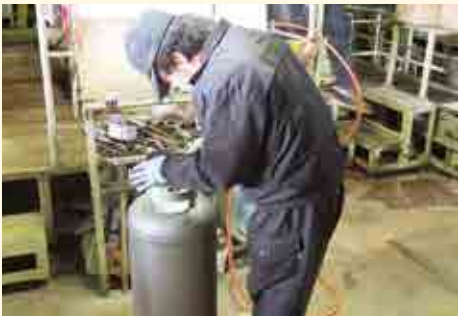
LP ガス容器内部検査