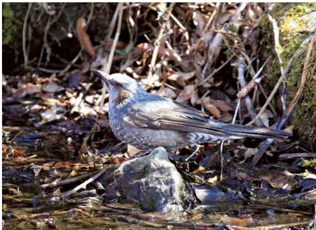
写真:ヒヨドリ (撮影:平成29年2月22日)