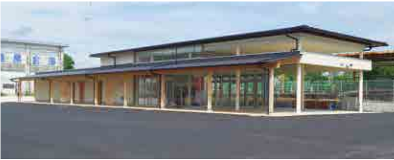
京町温泉駅観光交流センター外観

☎市観光商工課 観光係 ☎35-1114 (直通) (交流センターについて) ☎市企画課 政策係 ☎35-3712 (直通) (ツアーについて)