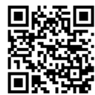
↑アプリをダウンロード

4月1日から、スマートフォン決済サービス「PayB(ペイビー)」で市税などが納付できるようになります。納付書のバーコードを「PayB」で読み取るだけで、いつでもどこでも納付できます。 【対象となる税金と料金】 市県民税（普通徴収）、固定資産税、軽自動車税、国民健康保険税（普通徴収）、後期高齢者医療保険料（普通徴収）、介護保険料（普通徴収）、保育所利用料、住宅使用料、水道料、奨学金返還金 【必要なもの】コンビニ用納付書、スマートフォン 【決済手数料】無料 【利用可能な金融機関】 宮崎銀行、鹿児島銀行、ゆうちょ銀行ほか ※利用可能金融機関は順次拡大中 【利用方法】 ①アプリをダウンロード ②氏名などを事前登録 ③バーコードを読み取り、暗証番号を入力 ④支払い完了 【注意事項】 領収書は発行されません。