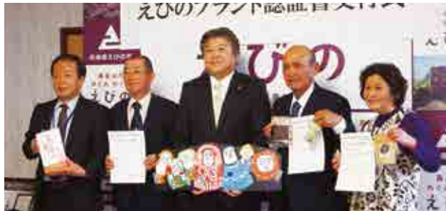
認証を受けたえびの市観光協会（左）と本坊農園（右）の皆さん