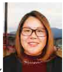
上江保育園家庭教育学級長