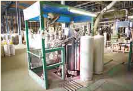
自動ネーミング装置