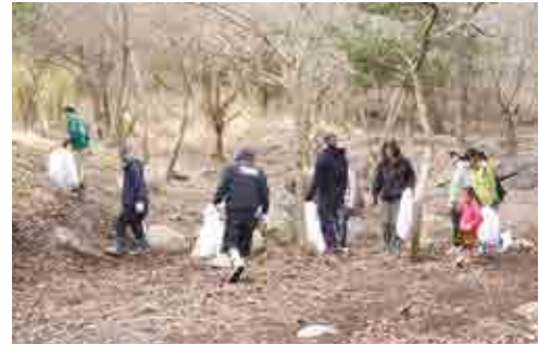
矢岳高原のごみ拾い活動