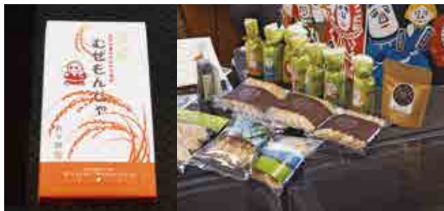
今回認証を受けた商品

2月22日、市役所で「えびのブランド認証書交付式」が行われました。この制度では、地域の優良産品を、その地域の特産品ブランドとして他産品と区別化し付加価値を付けて売り出すことで、特産品の販売促進を図ります。