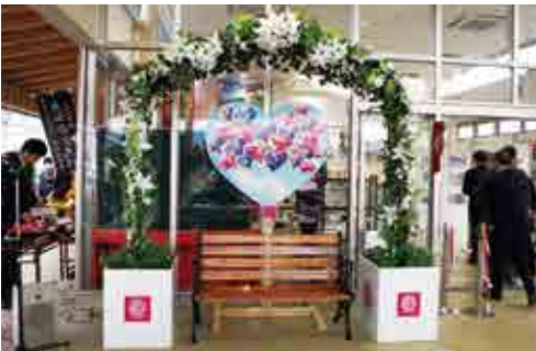
屋外交流スペースのインスタ映えスポット

同センターは、平成29年11月に建設着工。平成30年7月から観光案内所や休憩スペースの供用を開始しました。JR京町温泉駅舎は県道の拡張工事に伴い平成30年9月に取り壊されました。屋外交流スペースには、インスタ映えスポットや顔出しパネルなどの写真撮影スポットが設置されています。2月25日から駅ホームへの乗降口が一部利用可能となったことに併せて、オープニングセレモニーが行われました。