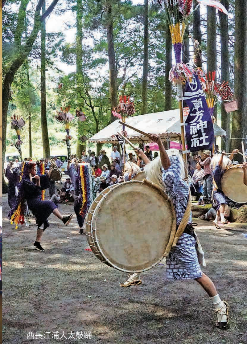
西長江浦大太鼓踊