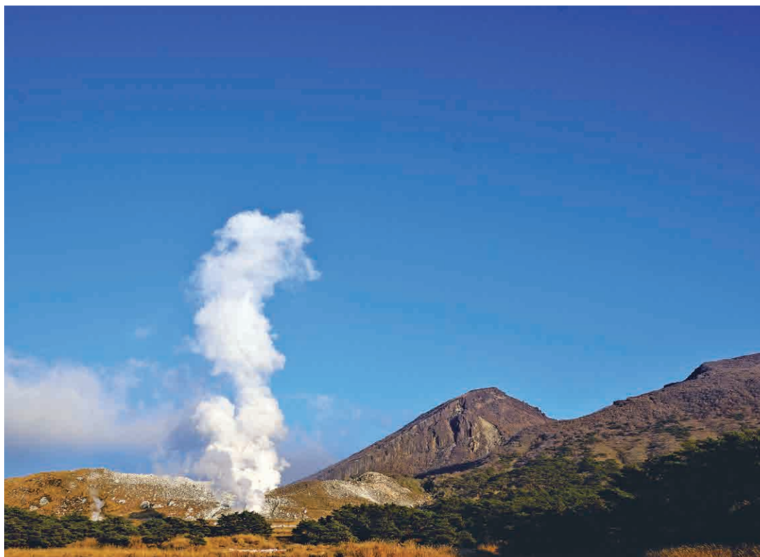
写真:空高く噴気を上げる硫黄山(撮影:平成30年11月5日)