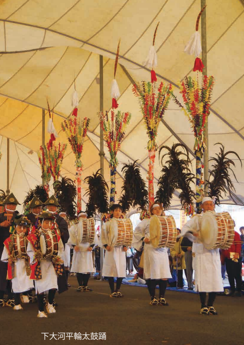
下大河平輪太鼓踊

室町時代、島津軍の軍勢が祁答院の蘭牟田城を攻め落とすため、太鼓踊を仕立てて城中に送り込み、踊り子は刀と槍を隠した三本立ての矢旗を背負い、城に攻め入り、城を落としました。西目(加世田・川辺など)地方からえびのに移住した人たちが地元の人々に教