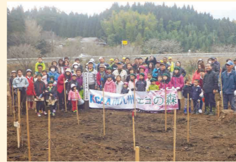
植樹祭で約2,100本の山桜を植栽