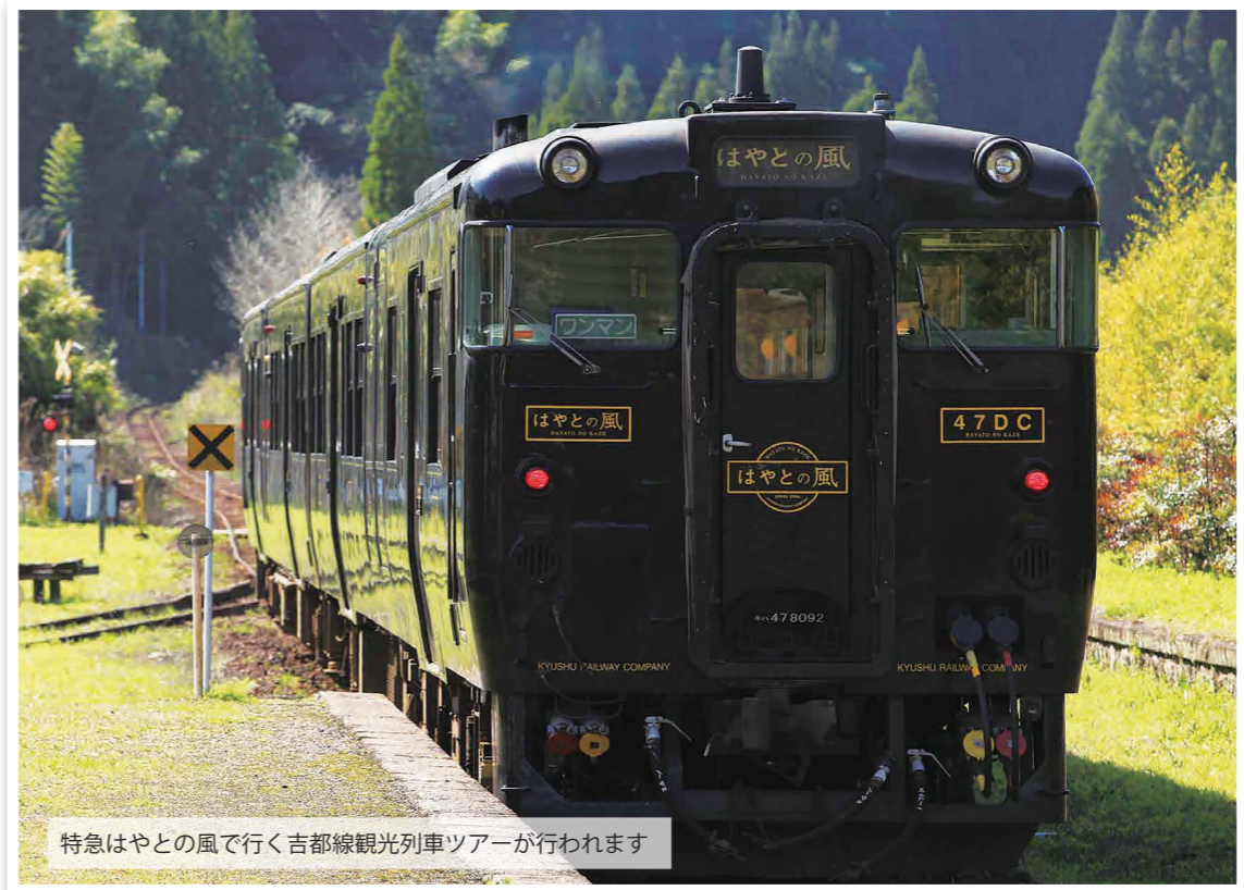
特急はやとの風で行く吉都線観光列車ツアーが行われます