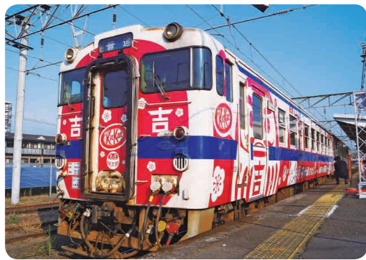
ラッピングされた列車

ラッピング列車のデザインは、県立小林高等学校美術部の生徒が考案しました。また、列車内には「乗ると願いがかなつくり車」の設置や外装のデザインと合わせたシールで装飾しています。