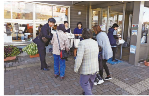
道の駅えびので広報活動を行う高校生