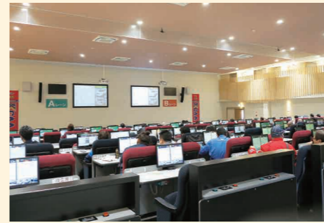
オークション会場