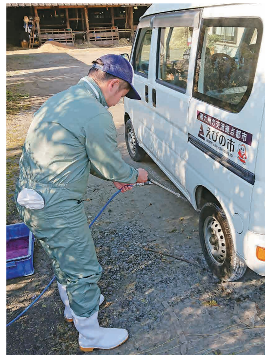
消毒の徹底をお願いします

【口蹄疫】平成30年4月から10月に中国、4月に韓国、5月にモンゴルで口蹄疫の発生が確認されています(平成30年12月12日現在)。近隣国である韓国では、平成29年2月以来の発生となっており、国内へ侵入する可能性が高い状況が続いています。