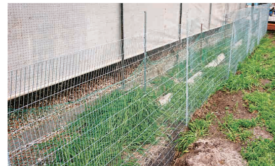
野生動物侵入防止対策をしましょう

市内で発生した口蹄疫終息から8年が経過し、防疫意識の低下が指摘されています。畜産農家の皆さんは、飼養衛生管理基準を順守し、野生動物の侵入防止や畜舎の清掃・消毒、立入者記録簿の記入、農場内外の長靴の履き替え、車両消毒、踏込消毒槽の点検を徹底し、防疫対策の強化に努めてください。