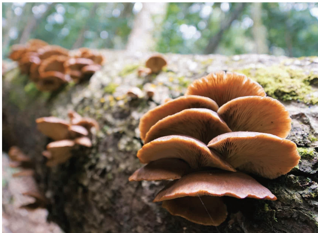
写真:ヒラタケ (撮影:平成30年2月25日)