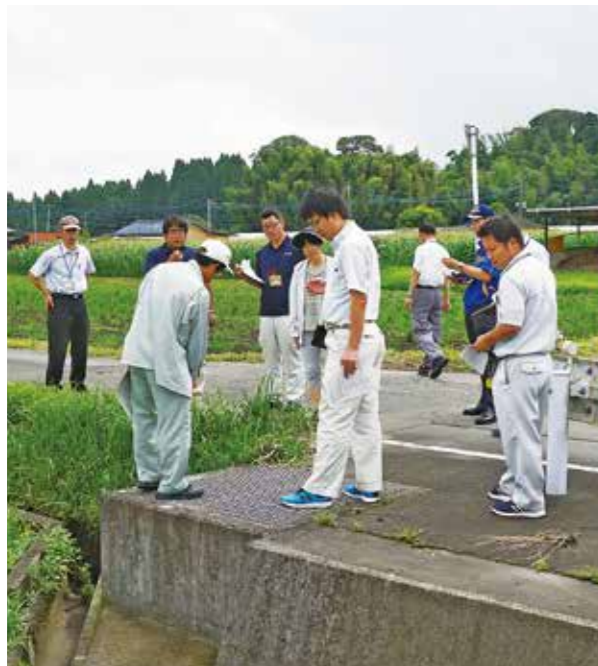
各関係機関が合同で危険箇所を点検

8月2日、市教育委員会では、子どもたちの通学の安全を確保するため、各小学校区で「通学路危険箇所合同点検」を実施しました。各学校では、子どもたちに登下校時の安全指導を行っていますが、ハード面の整備は各関係機関の協力が必要です。この点検は、各関係機関と合同で行うことで、危険箇所の情報を共有し、改善するために実施したものです。