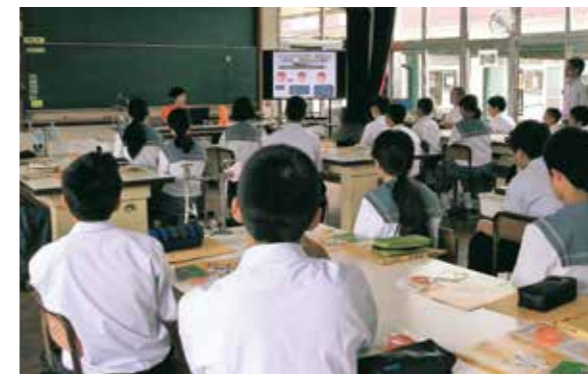
真幸中学校で認知症サポーター養成講座を行いました

また、認知症発症のリスクを少なくするために、運動をはじめとする生活習慣病対策をしたり、外出の機会を増やしていろいろな人とコミュニケーションを図ったり、趣味活動を楽しむなど、刺激ある生活を送って脳を活性化させることが大切です。