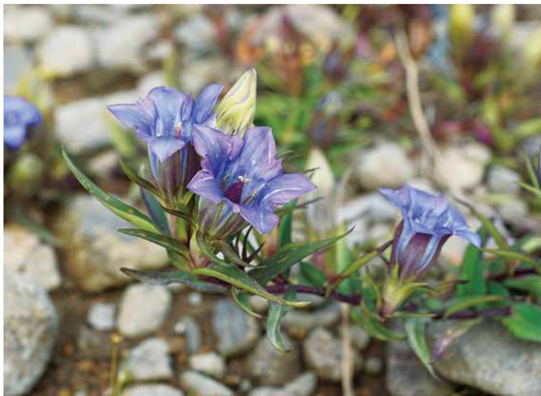
写真:リンドウ (撮影:平成29年10月10日)