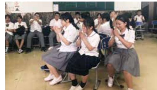
ゲームなどを行って交流を深めました

市では、8月20日から25日まで中国長春市留学生交流事業として中国吉林省長春市を訪問しました。これは、えびの市内にある高等学校の生徒が、長春日章学園高中(高校)の生徒との交流を通して、お互いの伝統・文化を理解し、国際感覚豊かな人材の育成を図ることを目的に行われたものです。