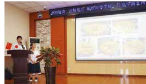
各学校について発表を行いました