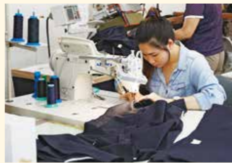
学生服の縫製工程