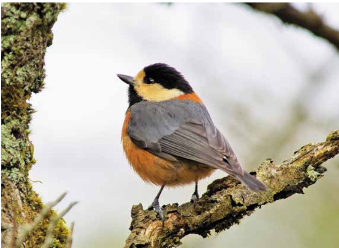
写真:ヤマガラ (撮影:平成29年1月11日)