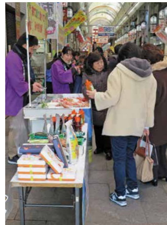
会場は多くの来場者でにぎわいました

イベントでは、特産品であるきんかんとまたまや焼酎の販売などが行われました。えびのからは、お茶や蜂蜜、鶏