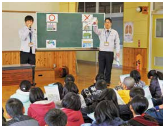
1月23日に飯野小学校で6年生を対象に租税教室を行いました

理解を得るために、小・中・高等学校で租税教室を実施しています。租税教室では、税に関するDVDを鑑賞するなど、税の仕組みについての学習などを行っています。