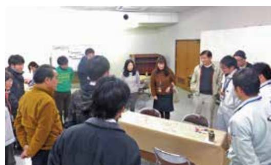
対話の後には参加者全員で意見を共有しました