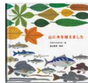
山に木を植えました スギヤマカナヨ／著 (講談社)

山に、色とりどりの大漁旗がひるがえりました。看板には「森は海の恋人植樹祭」と記されています。よごれてしまった海を元気に海にとりもどしたいと、気仙沼湾でカキの養殖をしている漁師さんたちが、落葉広葉樹を植えるはじめたのです。多くの種類の木を植えると、多くの種類の虫や鳥、動物たちが森にやってきます。森でつくられる養分を、川が海に運び、海の森をそだてるのです。その仕組みがこの本にわかりやすく書かれています。