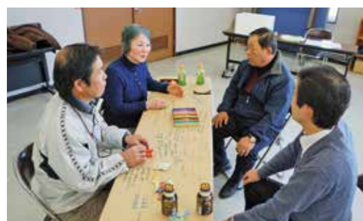
カフェスタイルで対話する参加者