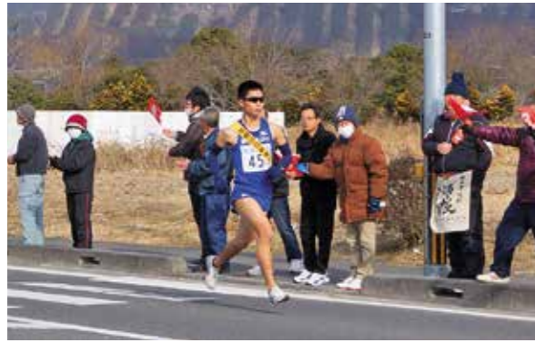
第72回南九州駅伝競走大会 14年ぶりの出場

2月4日、「第72回南九州駅伝競走大会」が行われました。駅伝は、真幸地区体育館前からスタートし都城市立美術館前をゴールとした7区間61・3kmで行われ、45チームが出場しました。えびの市からは、自衛隊員を中心に構成された道の駅えびのチームが出場しました。これは、14年ぶりの出場です。結果は、3時間40分18秒で38位でした。治道では、市民の皆さんが「頑張れ」と手を叩きながら声援を送っていました。