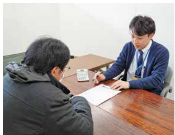
やむを得ない場合は放置せずご相談ください

A 滞納額が少額でも、滞納にかわりはありません。同じように滞納処分を行います。また、分割納付中でも、納付が履行されないことや、相談内容と実際の財産等に違いがある場合は、滞納処分の対象となります。