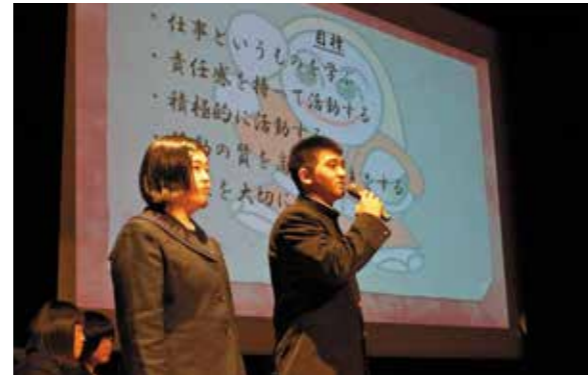
グローバル学習成果発表会 成長の証を示す

2月4日、「第72回南九州駅伝競走大会」が行われました。駅伝は、真幸地区体育館前からスタートし都城市立美術館前をゴールとした7区間61・3kmで行われ、45チームが出場しました。えびの市からは、自衛隊員を中心に構成された道の駅えびのチームが出場しました。これは、14年ぶりの出場です。結果は、3時間40分18秒で38位でした。治道では、市民の皆さんが「頑張れ」と手を叩きながら声援を送っていました。