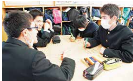
高校生からさまざまな意見が出されました