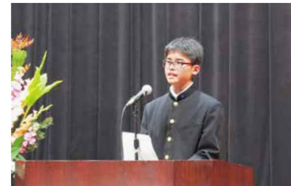
平成30年わけもんの主張西諸大会 平和で安全な社会にするために

10万人が訪れ、にぎわいました。多くの露店の他にも、えびの市消防団発足50周年記念事業やえびの駐屯地装備品等の展示、トライアルバイクショーやバナナのたき売りなどもあり、来場者はイベントを楽しんでいました。