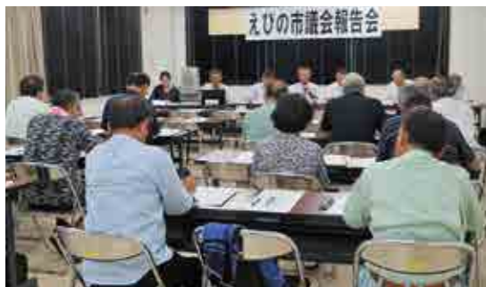
加久藤地区(市役所本庁1-1会議室)