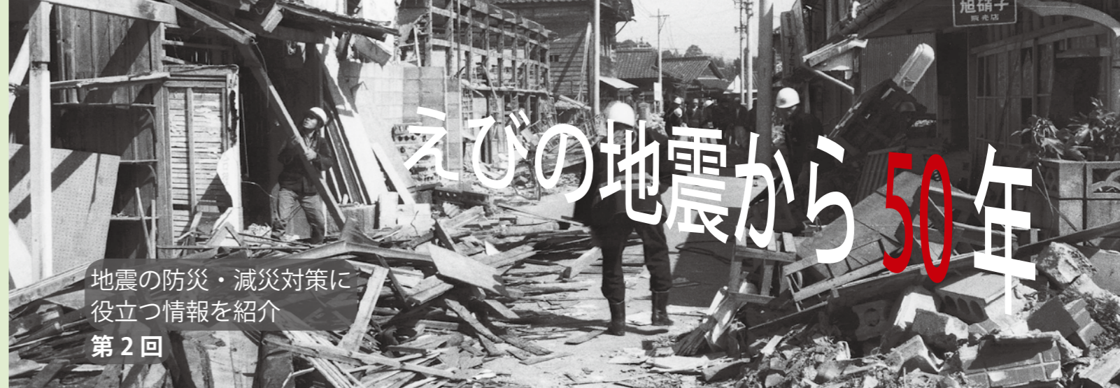
地震の防災・減災対策に役立つ情報を紹介 第2回

地震は、いつどこで起こるかわかりません。地震が発生したとき、被害を出さない、また、被害を最小限におさえるには、一人一人が慌てずに確実な行動をとることが極めて重要です。そのためには、地震が発生しても落ち着いて行動できるよう、日頃から地震の際の正しい知識と心構えを身に付けることが重要です。今日は、地震が発生したらどのような行動をとるかの例についてお伝えします。