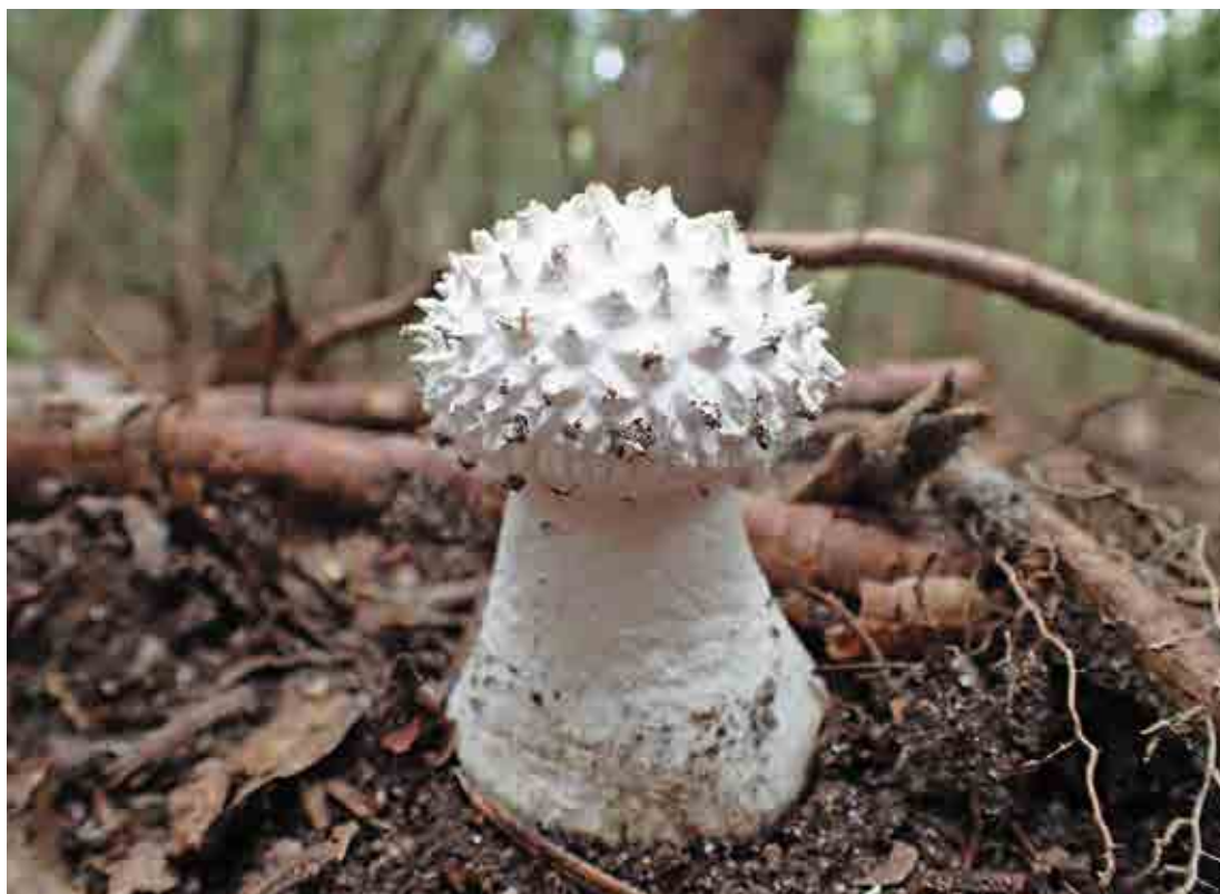
写真:シロオニタケ幼菌 (撮影:平成28年9月9日)