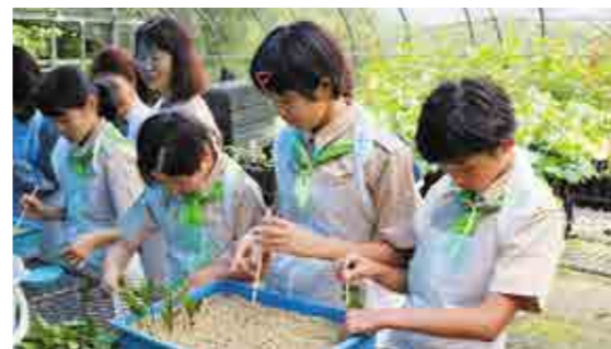
挿し木活動の様子

同大会は、みどりの少年団が、1年間でどのような緑化活動を行ってきたのかを発表するものです。大会には、宮崎県内のみどりの少年団のうち、5つの少年団が発表を行いました。