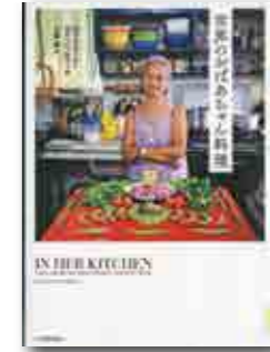
世界のおばあちゃん料理 ガブリエーレ・ガリンベル/著 (河出書房新社)

きょうは、もりのかくれんぼ。おには、らいおんさんです。「もういいかい。」「まあだだよー。」「ぼくもいれてー。」と小さなおともだちも仲間入りです。目を開けたらいおんさん。「あれあれ、みんなはどこにかくれたの?」らいおんさんは、上手くみんなを見つけられるでしょうか。なかなか見つからなかった小さなおともだちは、どこに隠れていたのでしょうか。とってもかわい