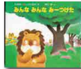
みんな みんな みーつけた 木村裕一/作・黒井健/絵 (偕成社)

きょうは、もりのかくれんぼ。おには、らいおんさんです。「もういいかい。」「まあだだよー。」「ぼくもいれてー。」と小さなおともだちも仲間入りです。目を開けたらいおんさん。「あれあれ、みんなはどこにかくれたの?」らいおんさんは、上手くみんなを見つけられるでしょうか。なかなか見つからなかった小さなおともだちは、どこに隠れていたのでしょうか。とってもかわい