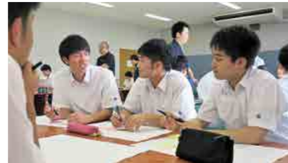
グループワークを行う飯野高校生