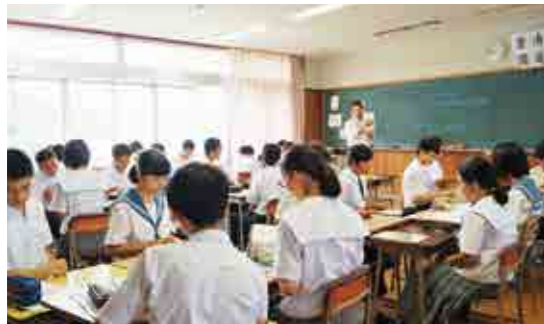
数学の授業を受ける生徒