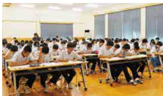
夏期セミナーで問題に取り組む生徒