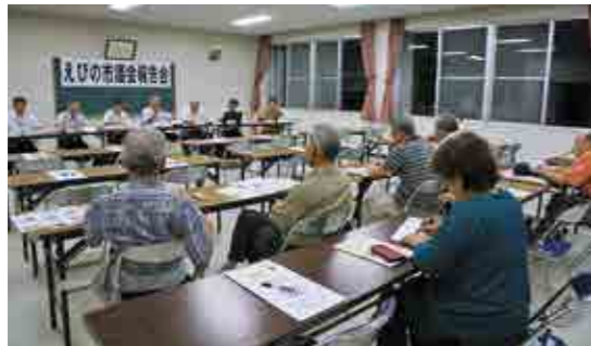
上江地区(上江地区コミュニティセンター)

数、工業団地、通学路、産科医についてなど、さまざまな質問が出され、各会場に出席した議員が回答しました。