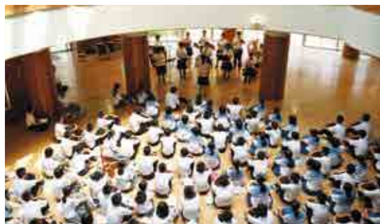
飯野高校吹奏楽部が演奏を披露しました