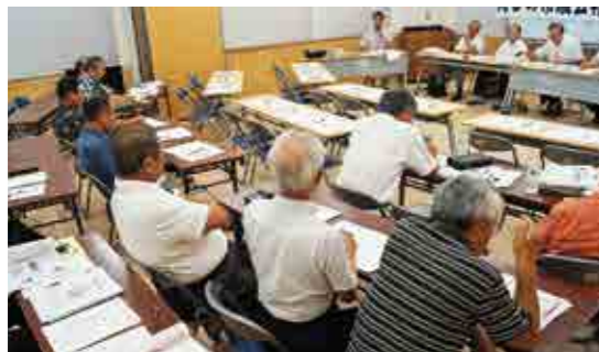
真幸地区(真幸地区コミュニティセンター)