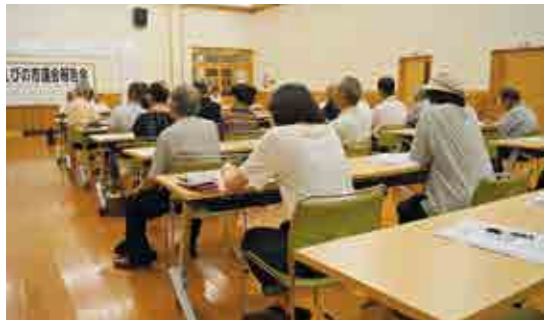
飯野地区(飯野地区コミュニティセンター)

昨年度は、1日で昼の部と夜の部の2回に分けて行われました。今年度は、議員が2班に分かれて、各中学校区で行われました。飯野地区が25