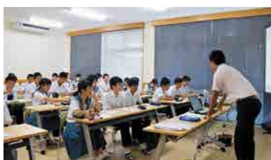
国語の文法のポイントを学びました