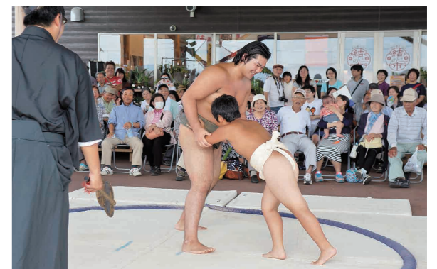
大相撲武蔵川部屋えびの合宿 多くの市民と交流

8月20日、宮崎市で県内26市町村が参加する「アサヒビールプレゼンツご当地グルメコンテスト2016inまつり宮崎」が開催されました。 えびの市は食味ランキング特Aのえびの産ヒノヒカリの上宮崎牛のステーキをのせ、市内の野菜を添えた「特大Aえびの米ぎゅうぎゅう膳」を出品しました。 開店直後から長蛇の列ができ、準備していた300食が約3時間で完売する人気で、結果は4位でした。