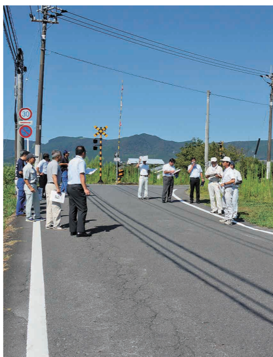
警察、道路管理者、教職員などが合同で点検