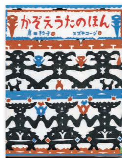
かぞえうたのほん