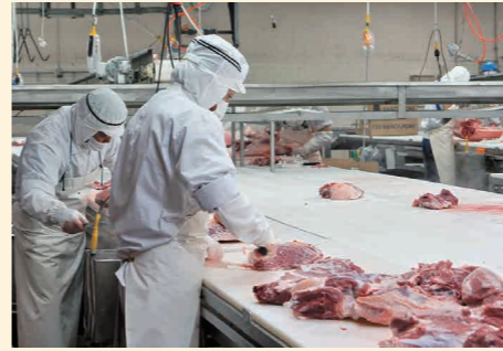
豚肉のカット作業