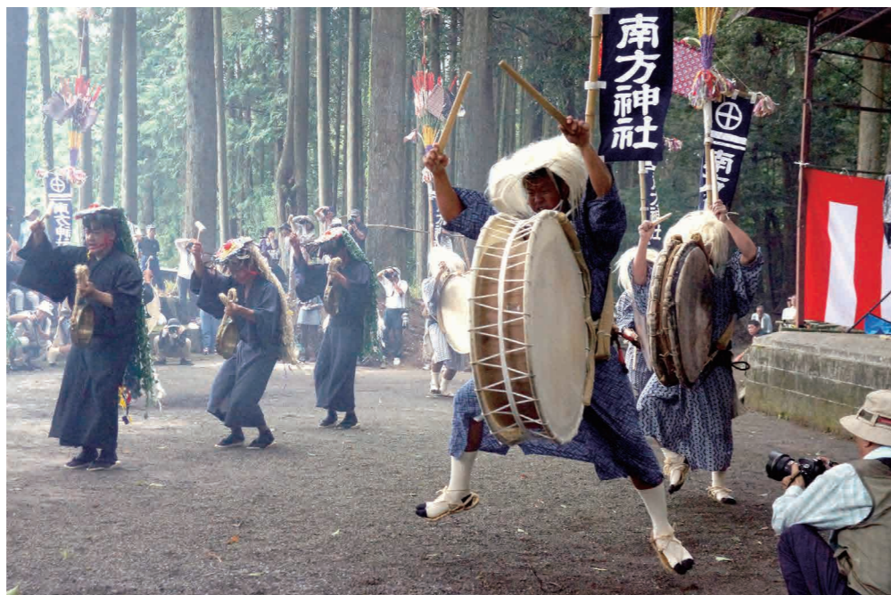
西長江浦の南方神社で大太鼓踊り

8月28日、西長江浦の南方神社などを会場に「大太鼓踊り」が行われ、西長江浦大太鼓踊り保存会の20人が踊りを披露しました。 大太鼓踊りは、通称「ウバッチョ（大バチ）踊り」ともいい、440年以上の歴史があります。