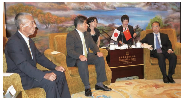
長春市張敬安副市長との会談