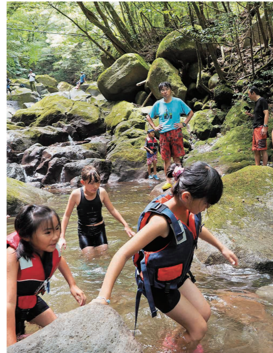
沢遊びを楽しむ参加者

森の中をハイキングし、帰り 道ではきれいな沢の自然の プールで水遊びを楽しみまし た。