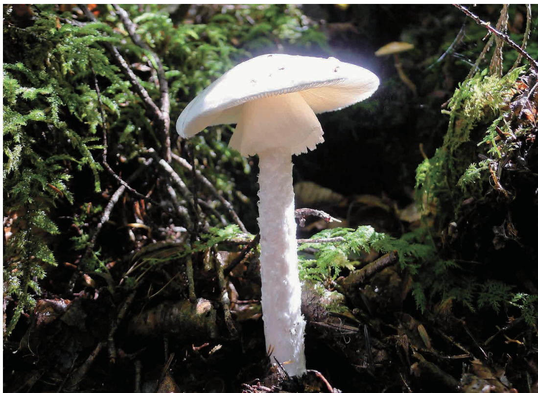
写真:ドクツルタケ (撮影:平成24年10月5日)