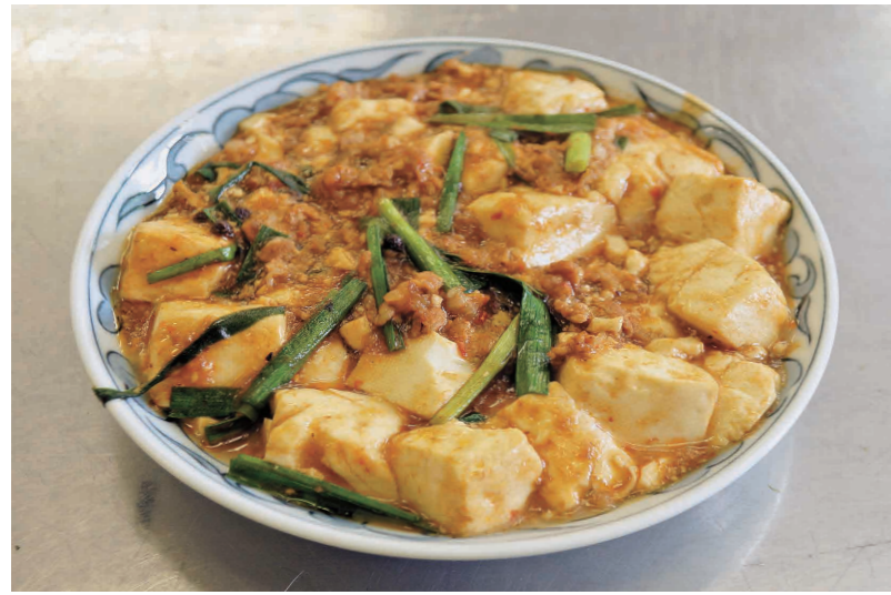
香りと辛味が食欲をそそる一品