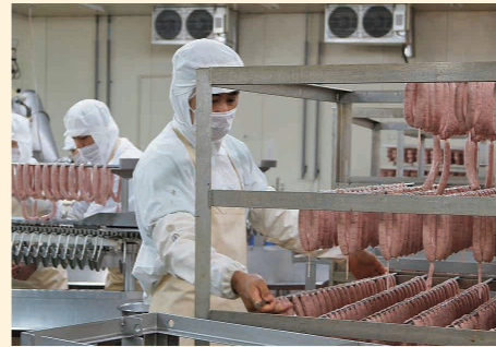
ウインナーの製造