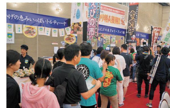
ご当地グルメコンテスト2016inまつり宮崎 えびの市ブースに長蛇の列

踊り手は、直径120センチメートルある大太鼓をかつぎ鉦と「ヤードッコイ」のかけ声に合わせて舞い踊ります。 訪れた多くの人たちは、踊り手の勇壮な舞いを楽しんでいました。