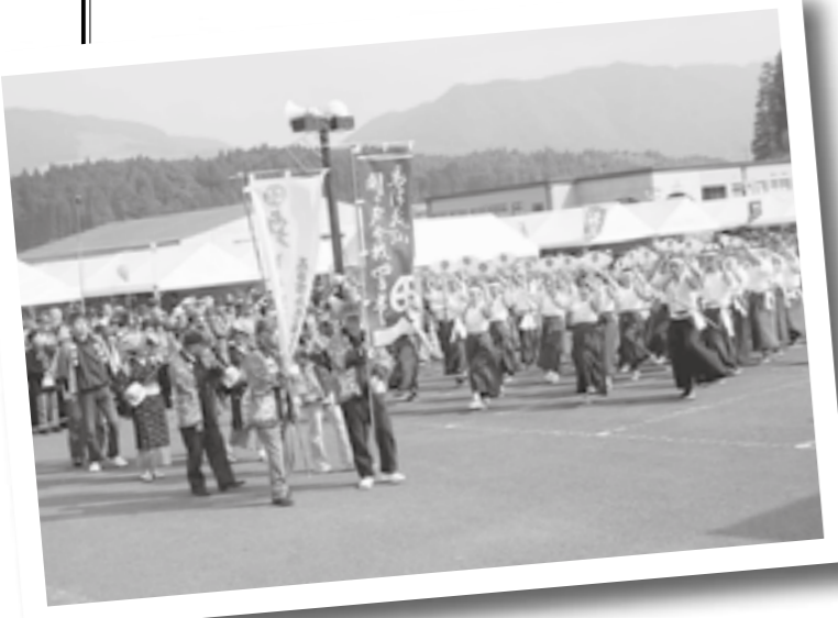
昨年の田の神さあひ里産業文化祭で披露された五日市兵児踊り。

私たちの五日市は、市の東部に位置し、集落の中央を国道221号線が東西に走る、兼業農家主体、戸数約1000戸の集落です。当地区の公民館施設は平成5年に古い住宅を購入したもので、修理・改修しながら住民の心よりどころとなっています。さて、公民館活動では各部署が組織され、地域の主な行事として、7月は地藏祭り、9月は敬老会と区民スポーツ