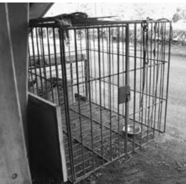
市では、月2回、「飼えなくなった犬の引取り」を設け、飼えなくなった犬を引き取っています。この檻はその犬を入れておくためのものです。この中に入れられた犬は、まるで飼い主を探るように、どこか悲しい声で遠吠えを繰り返します。

近年、「心豊かな生活を送るのに欠かせないパートナー」として、犬を飼う人が増えてきました。しかし、その一方で騒音や悪臭、農作物への被害など、隣近所とのトラブルも後を絶ちません。「隣の犬がほえてうるさい」、「散歩中にフンの後始末をしていない飼い主がいる」、「放し飼いの犬がいて迷惑だ」など、犬に關してのさまざまな苦情が寄せられています。