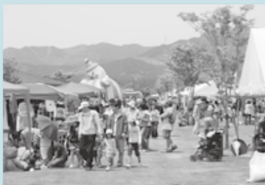
2日間、多くの人でにぎわったさわやかフェスタ。

「さわやかフェスタ」が、5月5日、6日の2日間、グリーンパークえびので行われました。これには、県内外から2日間で約18,000人も人が訪れました。2日間、フリーマーケットや特産品販売のほか、ふわふわ遊具コーナーや特設ステージでのダンスの披露など、子どもから大人まで楽しむことのできる盛りだくさんのイベントが行われました。6日には、川内川でドラゴンボート体験試乗も行われ、参加した人たちは、大きなドラゴンボートに乗って、川内川の優雅な流れを楽しんでいました。