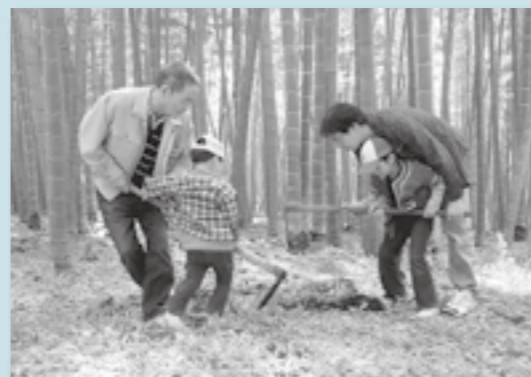
親子で竹の子狩りを楽しむ参加者。

きばつど村(上大河平竹林観光推進グループ)の竹の子狩りフェアが、4月20日、大河平小学校周辺の竹林で行われました。これには、市内外から約600人も人が訪れ、開放された広大な竹林で竹の子狩りを楽しみました。また、大河平小学校の運動場では、そばだご汁の振る舞いや、同地区で生産された農産物や加工品などの販売も行われました。宮崎市から参加した方は、「毎年このイベントを楽しみにしています。子どもと一緒に楽しむことができました。食べるのが楽しみです」と話していました。