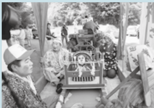
田の神さあのお披露目に回る永地区民。

田の神まつりが、5月4日、永地区で行われました。これは、今年一年間の五穀豊穡を願って毎年行われているものです。まつりでは、同地区民が田の神さあの汚れを落とす後、ペンキを塗り直しました。細かい所まで丁寧に色付けされ、数時間後にはきれいに化粧直された田の神さあができました。その後、田の神さあをトラックの荷台に乗せて、田の神音頭や三味線、太鼓の演奏に合わせて地区内をお披露目しました。最後は、田の神さあの前で神事を行い、五穀豊穡を願いました。