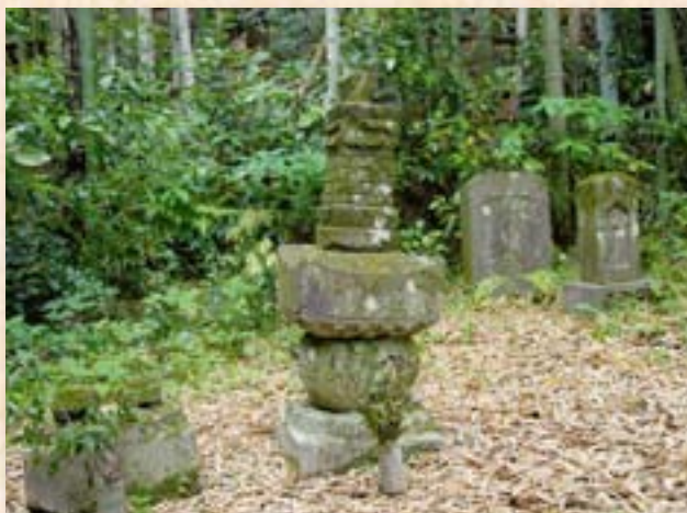
馬関田右衛門佐の墓塔と伝えられているもの（中央）。