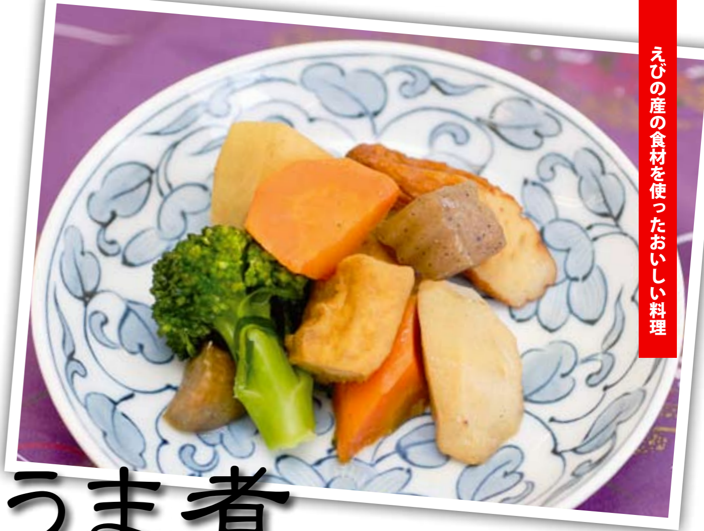
えびの産の食材を使ったおいしい料理