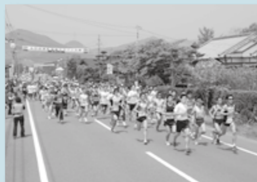
自己記録更新目指して一齐にスタートする選手たち。

えびの京町温泉マラソン大会が、4月27日、京町地区で行われました。今年で23回目となった同大会には、県内外から776人の参加がありました。大会は、真幸地区体育館前をスタート、ゴールとする3km、5km、10kmの部で競技が行われました。選手たちはピストルを合図に一齐にスタート。子どもから高齢者まで、選手たちは霧島連山をバックに、沿道からの声援を受けながら一杯走っていました。競技終了後には、今年のえびのの新米やえびのの物産品などが当たる抽選会も行われました。