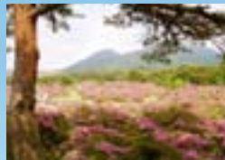
韓国岳のすそ野に広がるつつじヶ丘は、霧島屋久国立公園内でも指折りのミヤマキリシマの群生地です。