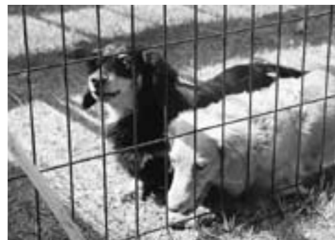
小林保健所衛生環境課では「しつけ」などの相談に応じしています。お気軽にご相談ください。