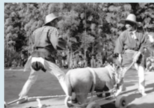
笑いの絶えなかった田遊び狂言。

約4km離れた両神社間を歩き来する神迎え行列の後、両地区民でモウソウダケを引っ張り合うカギ引きや木牛を使って田植えの準備をおもしろおかしく演じる田遊び狂言が披露されました。演者の熱演に、会場からは笑いと歓声が起こっていました。