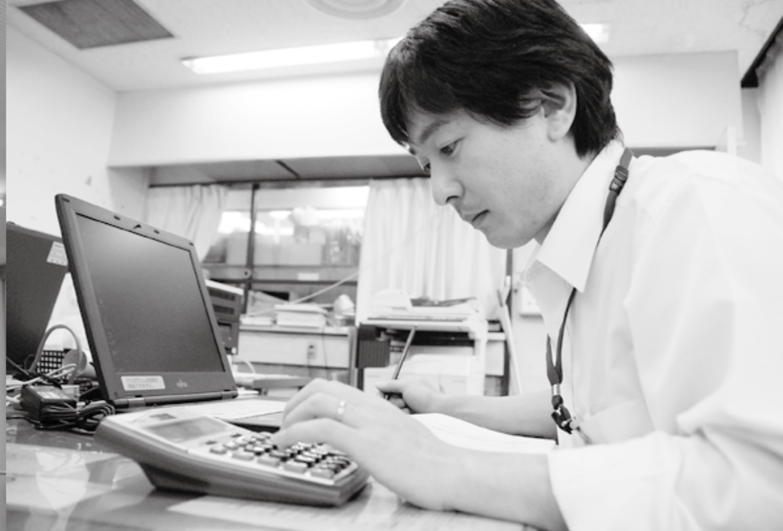
必死に経費計算を行う事務職員。職員一丸となって財政健全化に取り組みます。