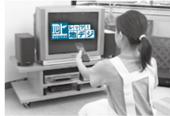
地デジの準備をお願いします。

現在のアナログ放送は平成 23年7月24日で終了し、地上 デジタル放送(以下地デジ) へ完全移行します。 地デジを見るためには、次 の①か②の対応が必要です。 ① 地デジ対応のテレビの購入 ② アナログテレビの場合、デ ジタルチューナーの購入 ※ アンテナ工事が必要な場合 もあります。 集合住宅や電波が届きにく い地域のために共同アンテナ をご利用の方は、施設の改修