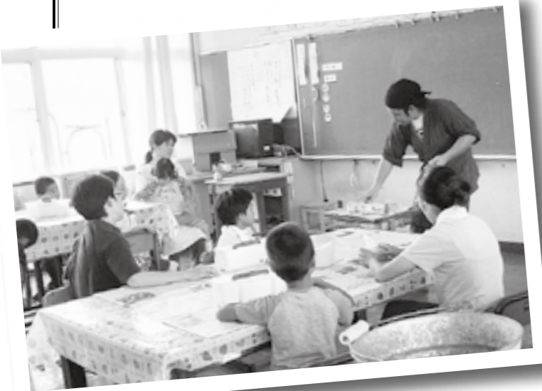
親子で参加した陶芸教室。子どもたちの豊かな創造力を見ることができました。

私たち岡元小学校家庭教育学級は「もみの木学級」です。これは昔から校庭にあるもみの木からつけた名前です。このもみの木は学校のシンボルでもあります。学級では、全PTA12人で活動しています。平成20年度の活動では、ゲームや歌を通して英会話を学ぶ英語リトミック教室や親子陶芸教室、親子手話講座と、親子で参加する講座を取り入れました。活動を通じて、普