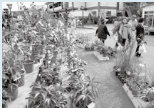
多くの植木が並んだ飯野植木市。

飯野植木市が、3月7日、8日の二日間、飯野町区商店街(飯野出張所周辺)で行われました。これには、二日間で約2万人の人が市内外から訪れました。歩行者天国となった通りには、植木や花、食料品など、県内外から約70店舗が軒を並べました。買い物に訪れた人は「これはどのくらい水をあげればいいのか」など、植木の栽培方法や管理方法を聞いていました。