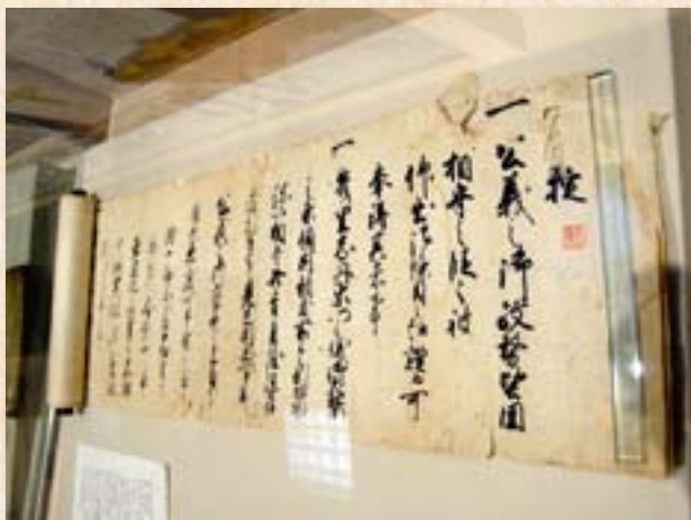
市歴史民俗資料館に保管してある「12ヶ条の掟」。