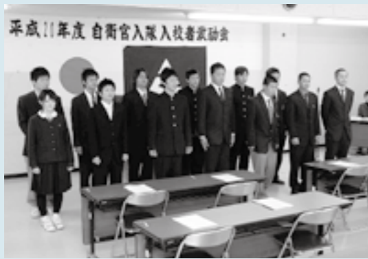
今春、自衛官に入隊入校する皆さん。

平成20年度自衛官入隊入校者激励会が、3月5日、市役所本庁で行われました。これには、自衛官入隊入校者やその保護者、自衛隊協力会など、53人が参加しました。今春、自衛官に入隊入校するえびの市出身者は15人。そのうち5人がえびの駐屯地に配属となりました。激励の言葉や先輩隊員の体験発表などが行われました。