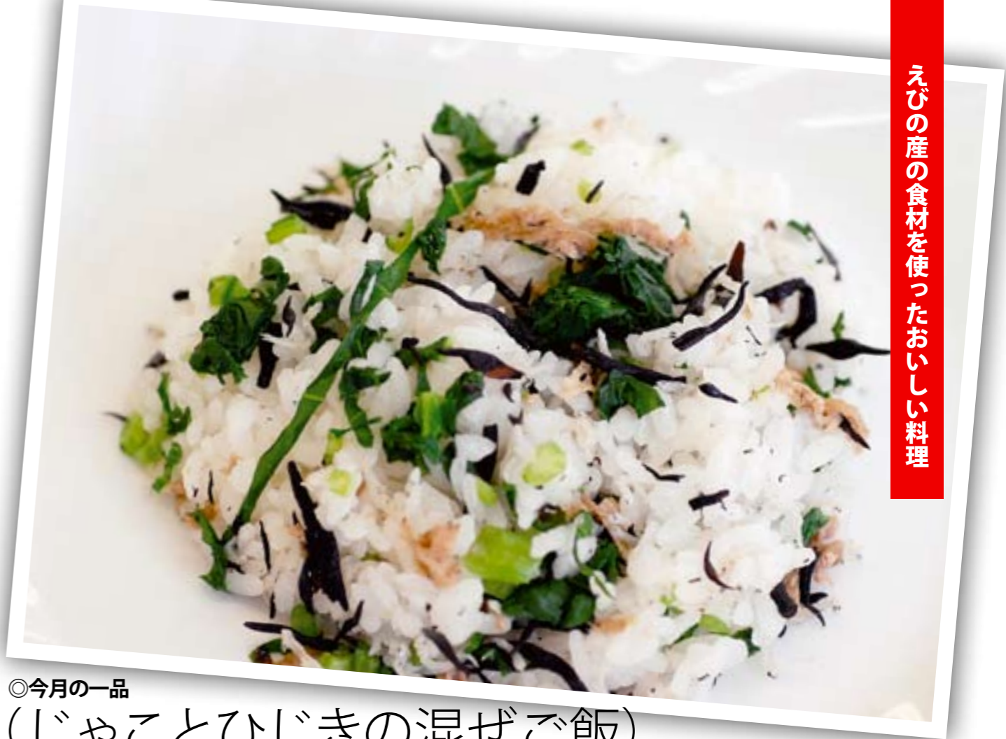
えびの産の食材を使ったおいしい料理

【開催日時】平成21年4月19日（日）午前9時～ 【会場】大河平小学校とその付近の竹林