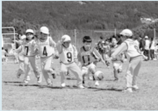
懸命にボールを追いかける園児たち。

コカ・コーラカップ宮日キッズサッカー大会が、3月1日、グリーンパークえびので行われました。これには市内外から46チームが参加。園児約500人のほか、保護者など約2千人が訪れました。試合で園児たちはゴールを目指して必死にボールを追いかけていました。ゴールが決まると、応援する大勢の保護者の皆さんは飛び跳ねて喜んでいました。