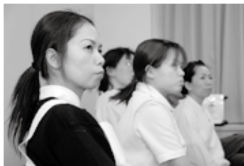
毎月一回行われる院内勉強会。勉強会を通してそれぞれの職員が持っている情報をみんなで共有しています。

全職員が常に心がけ、実践しなければなりません。以前は、病院職員の対応が悪いと市民からの苦情があったことも事実です。近年、このような苦情も少なくなりましたが、市民の皆さんが安心して医療を受けられる市立病院を目指し、今後継続して職員の接遇研修や院内会議(全職員)、院内勉強会を充実させ、職員の意識改革を進めます。