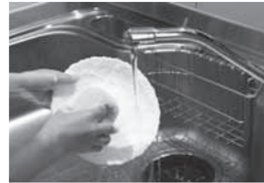
水は大切に使いましょう。

平成22年4月1日から、水道料金が改定されます。 改定内容については、 ①基本料金を一律約15%引き下げ ②従量料金を20円引き下げとなります。 実施が4月1日からですので、6月に請求する平成22年度2期分(4月・5月使用分)から新料金が適用となります。