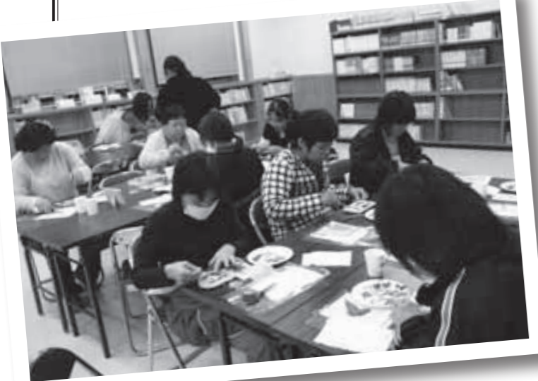
押し花でウエルカムボード作り。皆さん細かい作業に熱中していました。