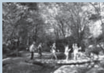
悠久の森ウォーキング。

この会は、モミジの苗を育てる里親制度を充足させて地域の緑化活動を実践しています。里親はモミジを育てながら季節を感じ、育てた苗を悠久の森に植えま。そうすることで、自分たちで森を育てることや、自然環境に触れ、自然の大切さを理解してもらう活動を行っています。