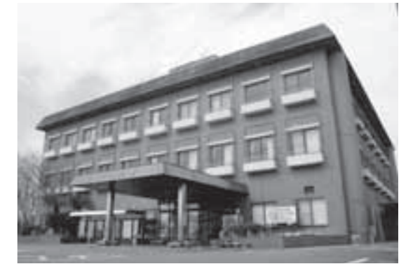
土曜診療が休診となるえびの市立病院。

平成22年4月1日から、えびの市立病院の診療体制が一部変更になりますので、お知らせいたします。 大学病院の深刻な医師不足の中で、内科が一部非常勤となり、これまで行ってきた土曜診療を、当分の間、休診とさせていただきます。また、午後診療につきましては、月曜日と水曜日の内科の予約のみとさせていただきます(救急患者につきましては、従来どおり受け入れます)。 生活習慣病・人間ドック等の健康審査業務も、これまで実施してきた件数を行うことが厳しい状況となりました。 平日の診療体制につきましては、下表のとおりとさせていただきます。 市民の皆さんには、大変ご迷惑をおかけしますが、医師が充足するまでの間、ご理解とご協力をいただきますよう、よろしくお祈いします。