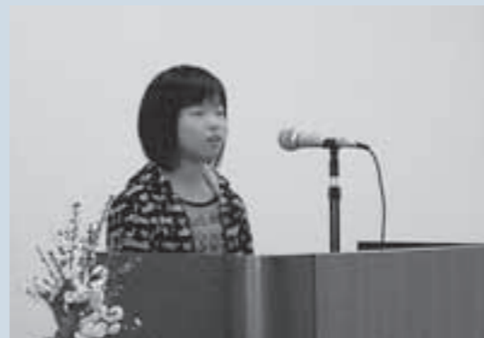
今年は小学生8人も参加しました。

小・中学生英語暗唱大会が、2月13日、市国際交流センターで行われました。これは、英語力を身につけるとともに、多くの人の前ではつきりと自己主張できるような児童・生徒の育成を図ろうと行われたものです。