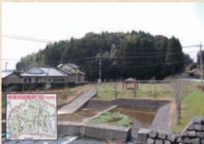
東川北地区の徳満城跡。左下の徳満城跡縄張り図は、当時の徳満城内の位置関係を示したもの。石碑の横（城跡の東側の道路沿い）に設置されています。

徳満城跡は、大字東川北徳満にあり、城郭は、西から高城、中之城、小城（下之城）の三区画に大別され、それぞれ深い空堀でしきられています。