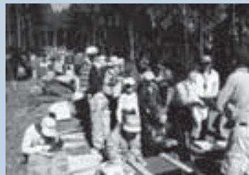
「もみじの森の会」が主催する植樹祭。