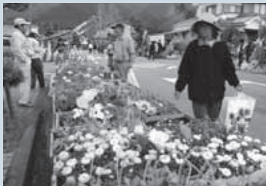
多くの花や植木が並んだ植木市。

飯野植木市が、3月6日、7日の2日間、飯野町区商店街(飯野出張所周辺)で行われました。歩行者天国となった通りには、植木や花を中心に、約80店が軒を連ねました。買い物客は、植木の特徴や栽培方法、値段などを聞いて品定め。皆さん、両手に植木を持ち、「帰って植えるのが楽しみ」といわんばかりの顔で帰っていました。