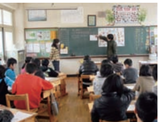
中学校教員が小学校に来る乗り入れ授業

えびの市では、一貫教育を中1ギャップなどの問題解決ばかりだけではなく、えびの市の未来を担う人材育成手段としても位置づけています。具体的には、一貫教育の目指す