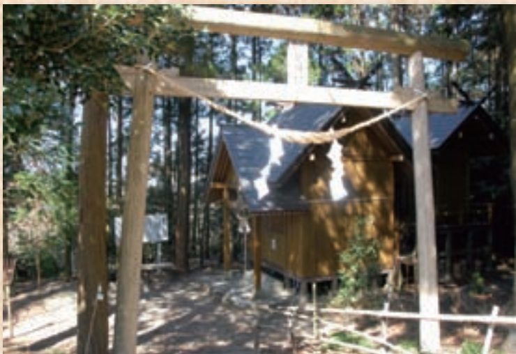
原田にある妙見神社