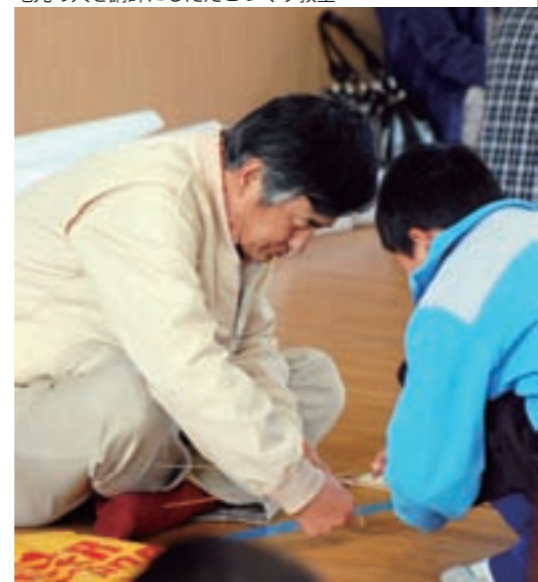
地元の人を講師にしたこづくり教室

伴い全国では、小学校の高学年（小学校5年生）から外国語活動が新たに設けられます。えびの市では、すでに、平成20年度から小学校3年生から外国語活動が行われています。