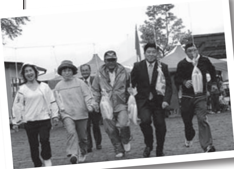
子どもから高齢者までのミニレクリエーション大会

少子化・高齢化が進む中、安全・安心で住みよい地域づくりに創意工夫を加えながら、今後も公民館活動に取り組んでいきます。