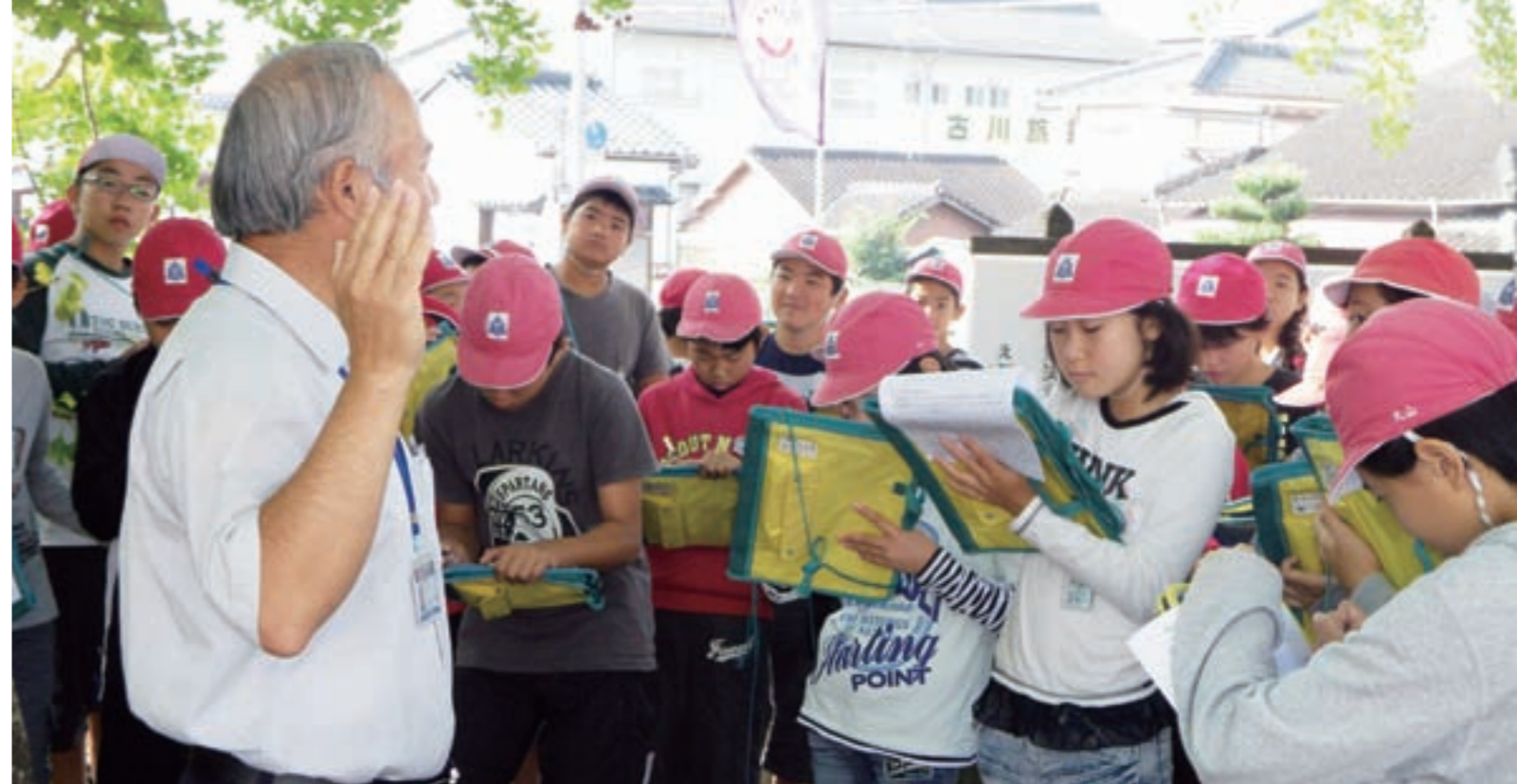
飯野小学校 6年生の史跡めぐり

ゲームを使うことで、子どもたちは楽しく授業に参加し、楽しみながら自然と英語を話すことができるようになります。