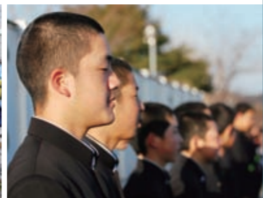
上江中学校で毎朝行われるあいさつ運動

ものとして、 ①「たくましいからだ、豊かな心、すぐれた知性」をそなえ、郷土に対する誇りと柔軟な国際感覚にあふれた子どもを育成。 ②新たな次代を担って行く気概を持った心身ともに調和のとれた子どもの育成が可能になると考えています。