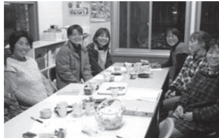
子育ての悩みなどを話し合う「子育て座談会」

上江保育園「ほほえみ家庭教育学級」を紹介します。今年度は、口蹄疫の影響などで活動が大幅に遅れ、十分な活動ができません。しかし、E・ネット安心講座、親育て講座など、上江小・中学校と協力し、合同で開催する行事もあり、ほぼ例年とおりの回数で家庭教育学級を実施することができました。 例年行っているみそづくりや陶芸教室、親子バス遠足など