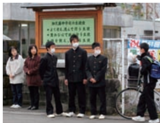
保護者も参加するあいさつ運動（加久藤中学校）