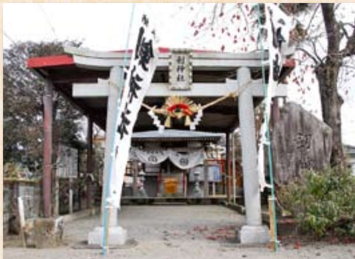
剣神社の前では、「明神の市」が開かれていました