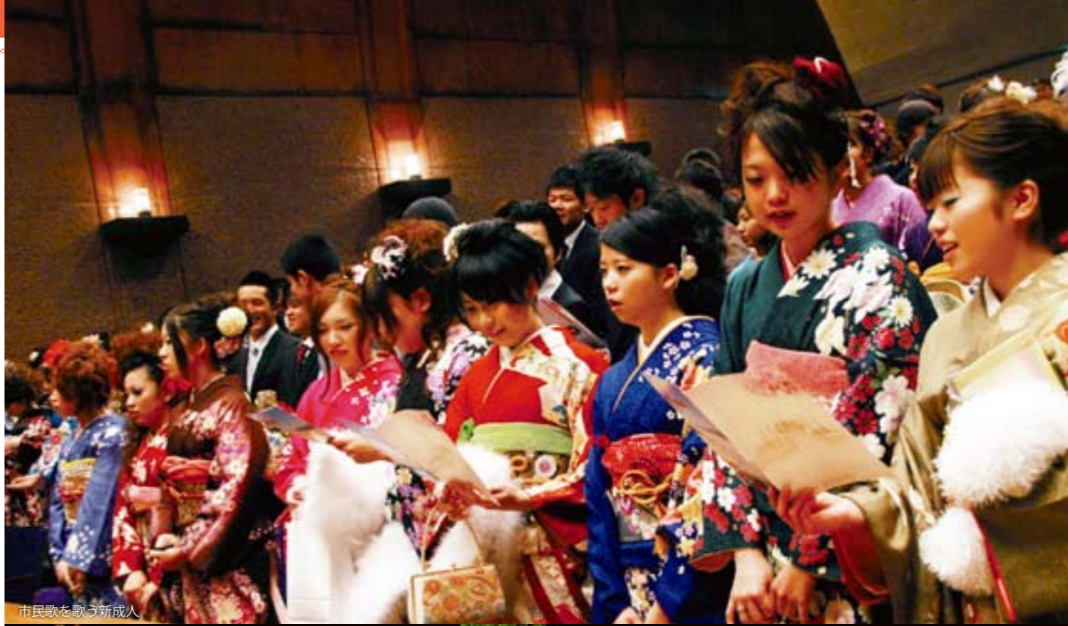
市民歌を歌う新成人