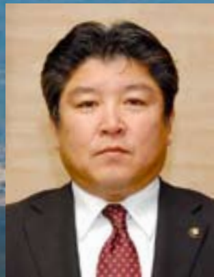
えびの市長 村岡隆明 Muraoka Takaaki