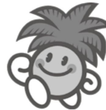
マスコットキャラクターの元気ちゃん

競技種目の一部には、全国健康福祉祭の県選手選考会を兼ねたものもあります。市民の皆さんの皆さんの参加をお待ちしています。