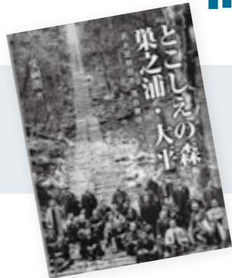
『とこしえの森業之浦・太平』