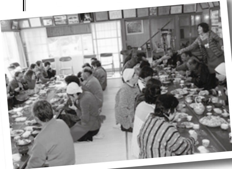
そば打ち教室後の懇親会

湯田地区は、えびの市の玄関口であるえびのインターに隣接しています。地区の真ん中には川内川が流れ、南側一面は、田んぼが広がっています。地域的には交通の便がよく、地区内には、南九州コカコーラボトリング、福山通運、九州中央オークション等の企業があります。 自治公民館活動は、秋の地区民総参加の「敬老運動会」、「十五夜祭り」、正月の「竹は