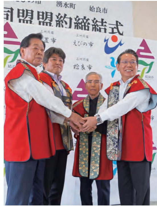
盟約締結後、4市町の首長が手を合わせました

【問い合わせ】 ☎0570-090-110 【市民環境課生活環境係】 ☎35-1111 (内線286)