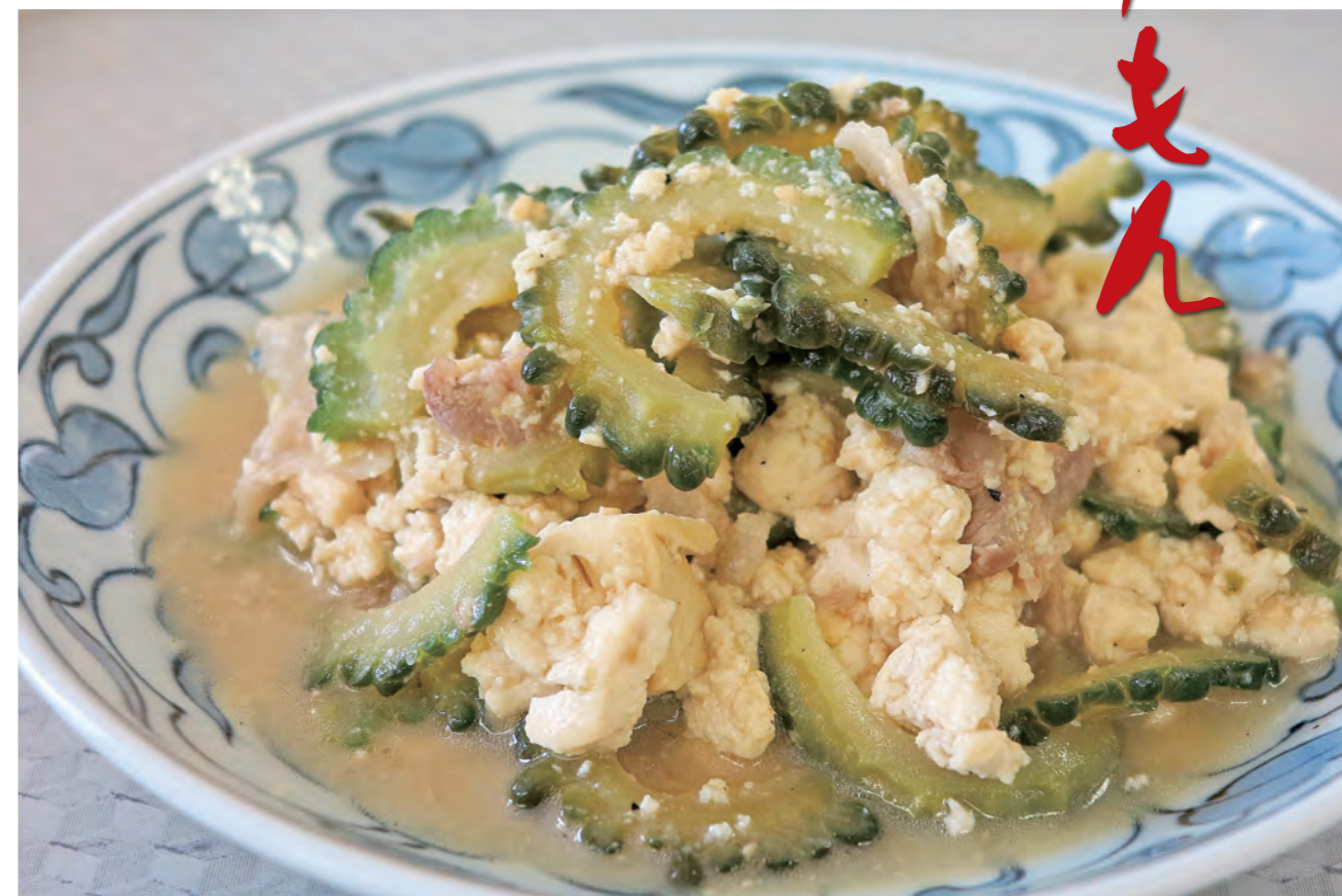
豆腐の自然な甘みとゴーヤの苦味が絶妙な一品

今月紹介するのは、男の腕まくり料理教室の皆さんが作った「ゴーヤチャンプルー」です。 チャンプルーとは、野菜や豆腐などを炒めた沖縄料理です。ゴーヤチャンプルーは、豆腐の自然な甘みとゴーヤの苦味が絶妙に混ざり合い、口の中に広がります。 料理のポイントは、豆腐の水気を十分に切ることです。豆腐の水切りが不十分だと水っぽい仕上がりになり、味も薄くなってしまいます。 また、ゴーヤの苦味が気になる人は、ゴーヤのわたをよく取り除き、ゴーヤを切った後で塩もみをしてください。そうすることでゴーヤの苦味を和らげることができます。