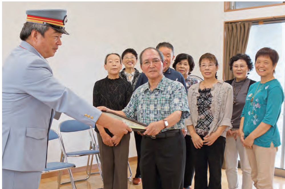
「えびの飯野駅をといちらかさん会」に感謝状 7年間の活動をたたえて

9月4日、「えびの飯野駅をといちらかさん会」がJR九州鹿児島支社から感謝状を贈呈されました。同日、飯野駅前区自治公民館で授賞式が行われました。 これは、同会が7年間継続して行ってきた、えびの飯野駅の構内