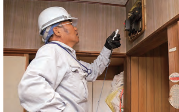
電気工事業協同組合が高齢者宅を訪問 プロの技でボランティア

8月31日、真幸アリーナで、「第47回宮崎県レクリエーション祭inえびの」が行われました。 この祭は、多様なレクリエーション活動を共に楽しみ、世代を超えた参加者同士の交流と活動への理解、普及を推進することを目的に、宮崎県レクリエーション協会の主催で毎年行われています。県内の17団体、約220人は、ダンス、体操、歌などを披露し、仲間との交流を深めていました。