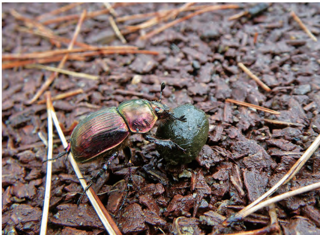
写真:シカのフンを運ぶオオセンチコガネ (撮影:平成21年9月25日)