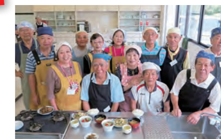
【紹介者】男の腕まくり料理教室の皆さん