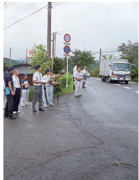
警察、道路管理者、教職員などが合同で点検

市教育委員会では、子どもたちの通学の安全を確保するため、8月8日、各中学校区で通学路危険箇所合同点検を実施しました。点検には、小林木事務所、えびの警察署、市建設課、市民協働課、市農林整備課、市学校教育課、各小中学校の教職員、県から派遣された通学路安全対策アドバイザーら約30人が参加。転落する恐れのある水路やガードレールのない通学路など約30か所を見て回りました。