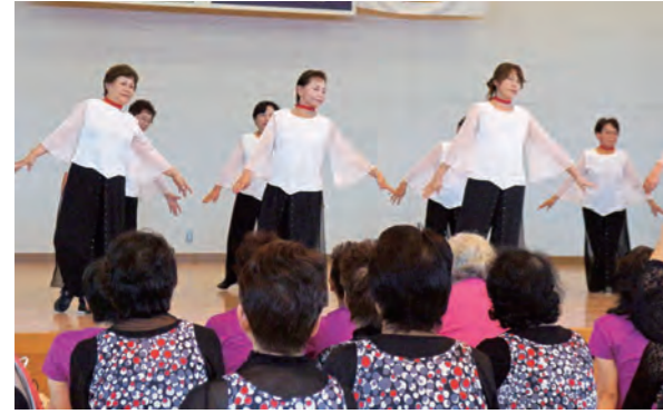
第47回宮崎県レクリエーション祭inえびの 活動の成果を披露

8月31日、真幸アリーナで、「第47回宮崎県レクリエーション祭inえびの」が行われました。 この祭は、多様なレクリエーション活動を共に楽しみ、世代を超えた参加者同士の交流と活動への理解、普及を推進することを目的に、宮崎県レクリエーション協会の主催で毎年行われています。県内の17団体、約220人は、ダンス、体操、歌などを披露し、仲間との交流を深めていました。