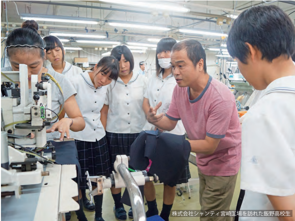
株式会社シャンティ宮崎工場を訪れた飯野高校生