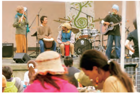
さまざまなジャンルの歌が披露されるえびロック