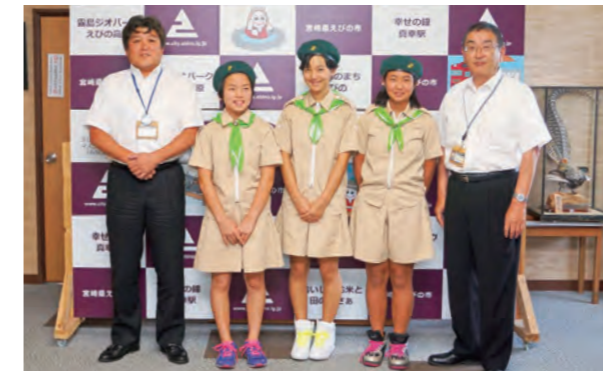
えびのみどりの少年団が最優秀賞を受賞 緑を守り育てる活動が評価

やトイレの清掃活動等が評価されたものです。 同会は、平成19年12月に発足しました。現在、飯野駅前自治会を中心に、周辺の企業や飯野高校生ら150人で、えびの飯野駅周辺の清掃活動等を行っています。