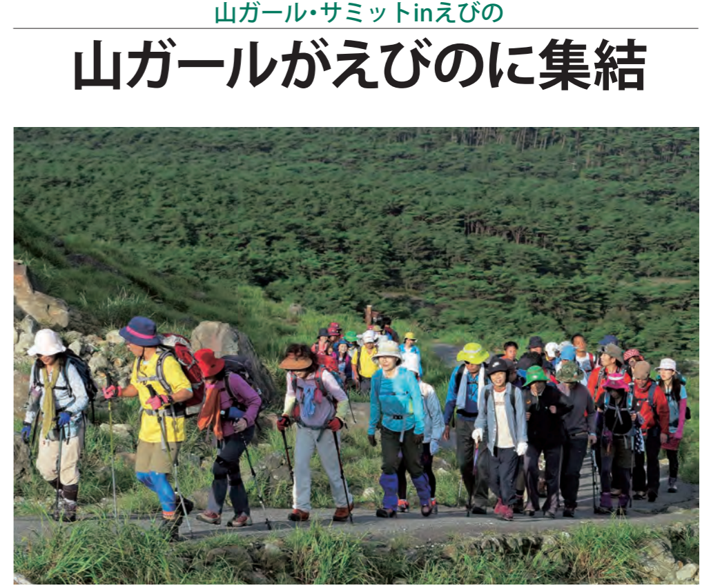
山ガール・サミットinえびの 山ガールがえびののに集結

8月23、24日、えびの高原を会場に「山ガール・サミットinえびの」が開催されました。全国の山ガールが一堂に集まり、情報交換や山を楽しみながらの清掃登山を行うイベントです。 全国各地から集まった約80人の