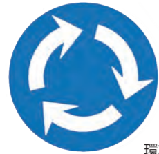
環状交差点の標識