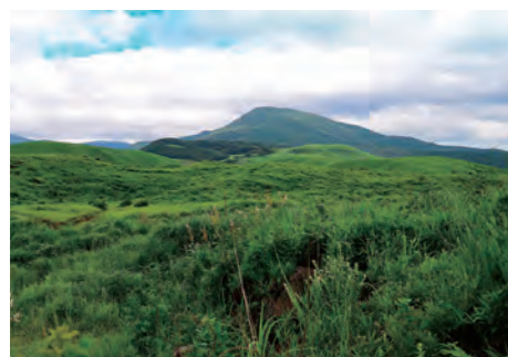
沢原高原から望む栗野岳

これは、環霧島探訪に掲載するため「湧水町から見える霧島山(栗野岳)の絶景」というテーマで、公民館学級「デジタル写真教室」の参加者に