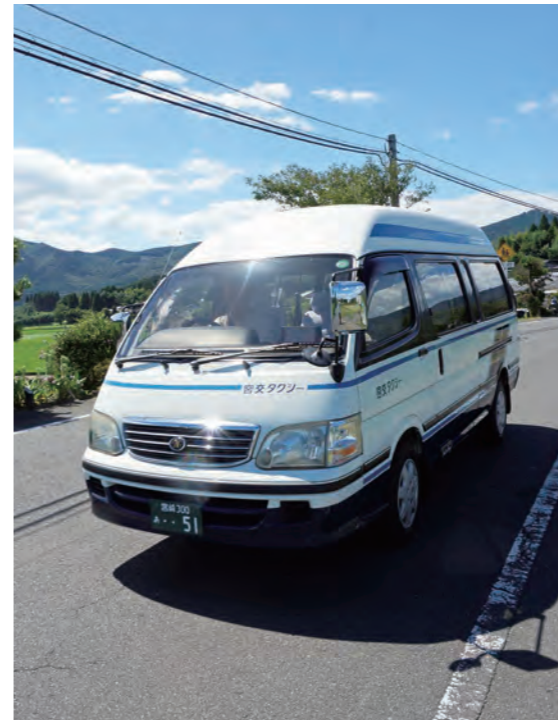
9月30日で実証実験運行は終了します

地域での実証実験の結果と東部地域での実証実験の結果を検証します。6月に実施した65歳以上の人を対象にした調査(地域公共交通に関する調査)結果も合わせ、えびの市に、より適した公共交通体系の在り方を検討してまいります。