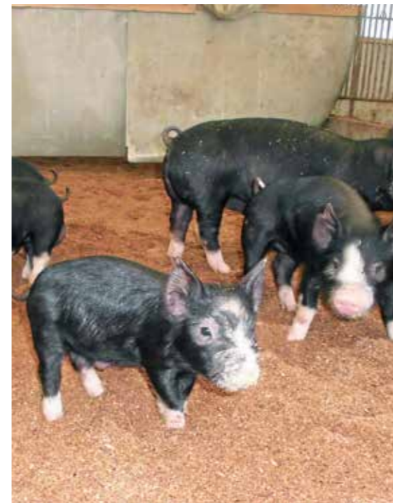
防疫の徹底をお願いします