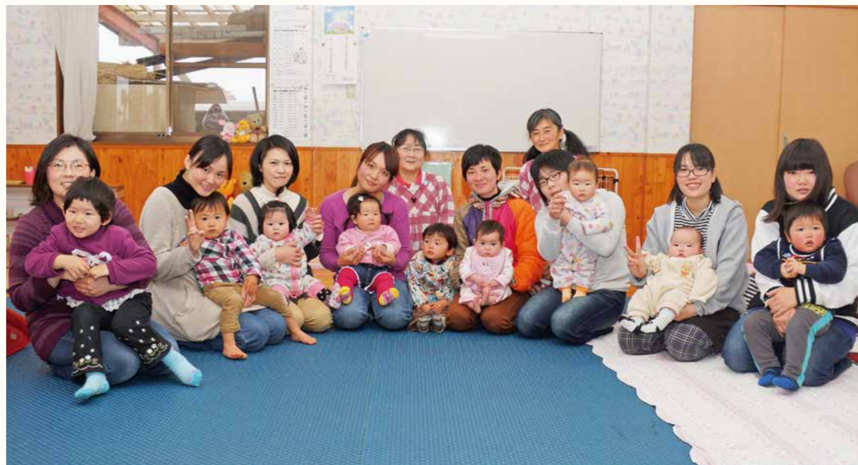
ほほえみ広場の参加者と同センター職員