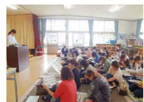
6月に行われた講演会の様子

を行いました。どの教室もたくさんの方に参加してもらい、喜んでもらいました。また、上江小中学校と合同で「親育て講座」に参加しました。 1月に行われた家庭教育講演会は、上江校区が担当でした。講演会では、進行や謝辞などを行いました。運営に携わることができ、貴重な体験ができました。 今年度、上江保育園家庭教育学級では、できる範囲の活動を計画、実践できました。参加、協力くださった皆さん、ありがとうございました。