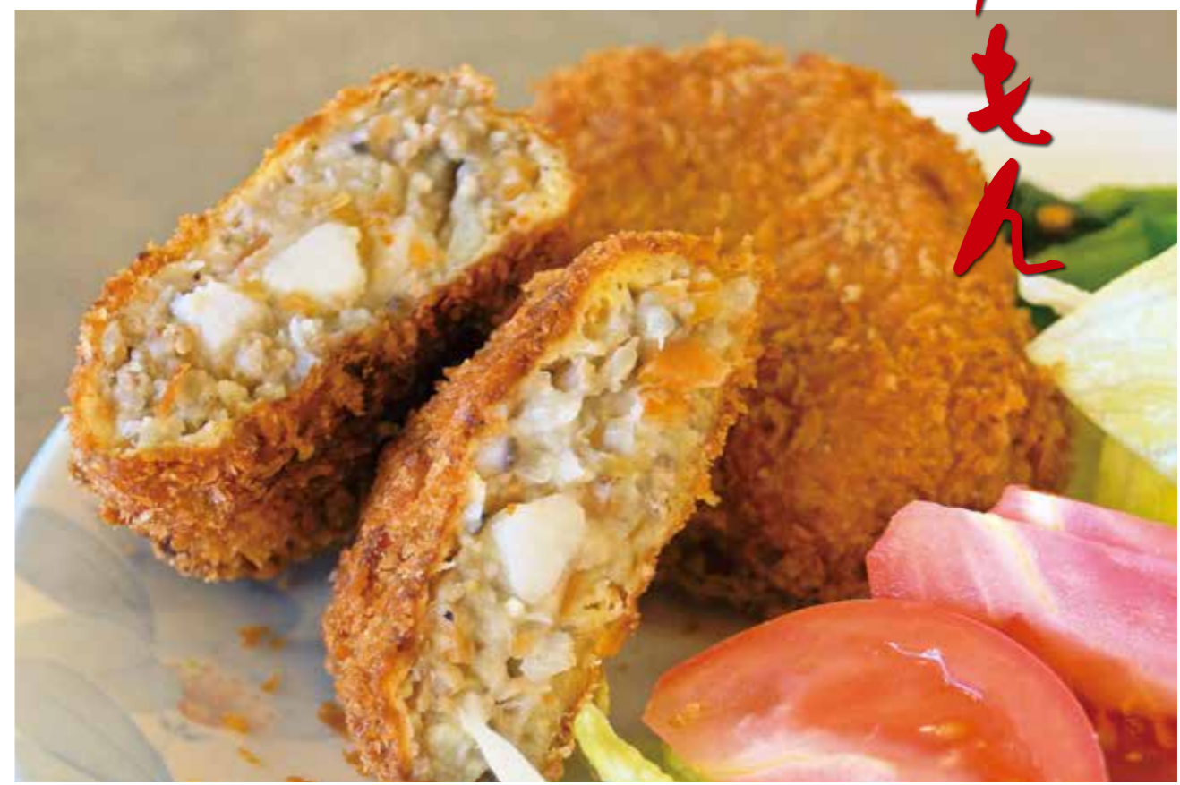
サトイモのトロっとした食感がたまらない一品

今月紹介するのは、ふるさと料理教室の皆さんがつくった「サトイモコロッケ」です。 サトイモコロッケは、ジャガイモコロッケとは違い、サトイモのトロっとした食感がたまらない一品です。サトイモの量を変えることで、よりトロっとした食感やフワフワとした食感を楽しめます。 料理のポイントは、食材のつなぎに小麦粉を使うことです。そうすることで、コロッケの形を作る時にまとまりやすくなります。 また、具材を炒めたあと粗熱をとることです。熱いままだと、形がくずれやすくなります。