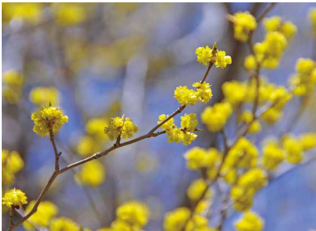
写真:シロモジ (撮影:平成23年4月28日)