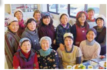
ふるさと料理教室の皆さん