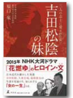
吉田松陰の妹 原口泉/著 (幻冬舎)

この本は、教科書に出てくる歴史人物のエピソードをイラストを交えて紹介しています。