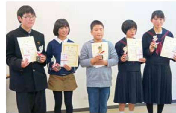
小中学生英語暗唱大会 英語力を暗唱で競う

でリフレッシュしてもらおうと、NPO法人アースウォーカーズの主催で行われたものです。 20日には、福島県の親子10組23人が、えびの市上江の西田農園を訪問。餅つきやニンジン収穫を体験しました。