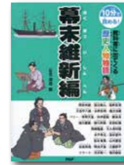
教科書に出てくる歴史人物 物語「幕末維新編」 河合敦/監修 (株式会社 PHP 研究所)