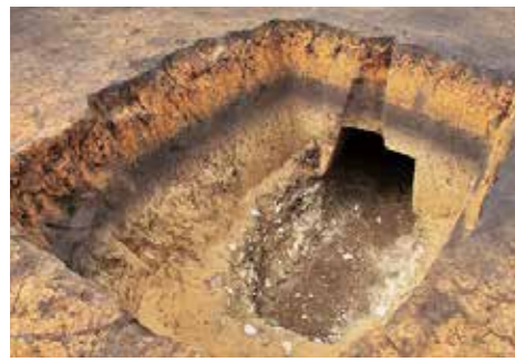
島内横穴墓群第139号墓

かというほどの珍しいもので「す」と話していました。 【基本情報】 ・年代は、5世紀末～6世紀(古墳時代中期末～後前期葉) ・島内地下式横穴墓群の中でも、最多・最上位の副葬品が完全な状態で出土 ・男女と考えられる2人が埋葬。追葬は、なし。 【特筆すべき点】 地位の高い首長層の古墳の場合、未盗掘で発見されたこと。 土に触れず、通常では腐ってしまうような、繊維や革などが多量に残存していること。 有機質や金属器が良好な状態で残存していること。 市社会教育課文化係 ☎ 35・2268