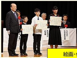
絵画・作文 コンクール表彰式