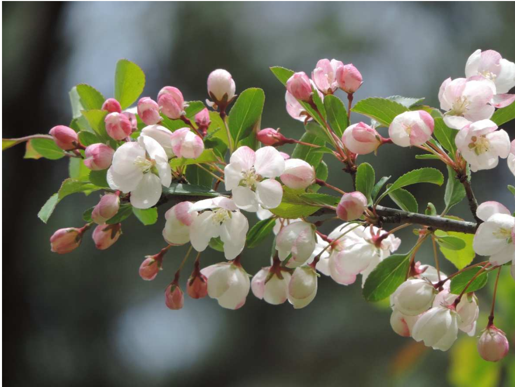
ノカイドウ自生地 (国指定天然記念物 所在地：えびの高原)