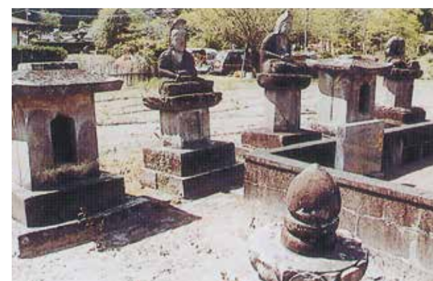
15 長善寺住職墓石群