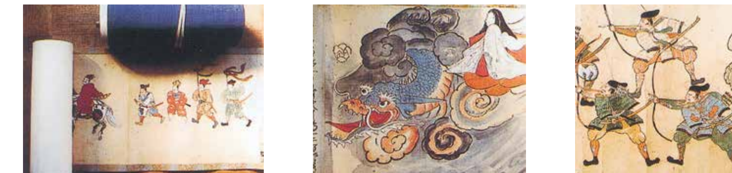
35 大戸諏訪神社絵巻物