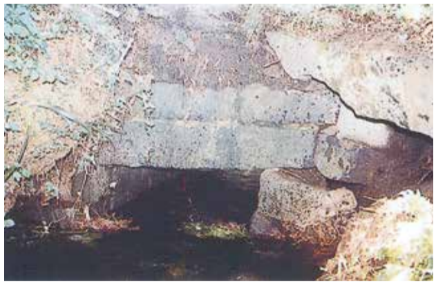
44 大平落 中橋