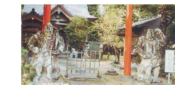
36 菅原神社 仁王像