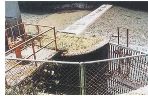
41 享保水路 井堰