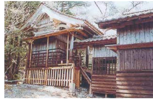
14 狗留孫神社関係遺跡