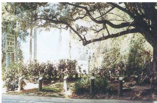
8 e 首塚