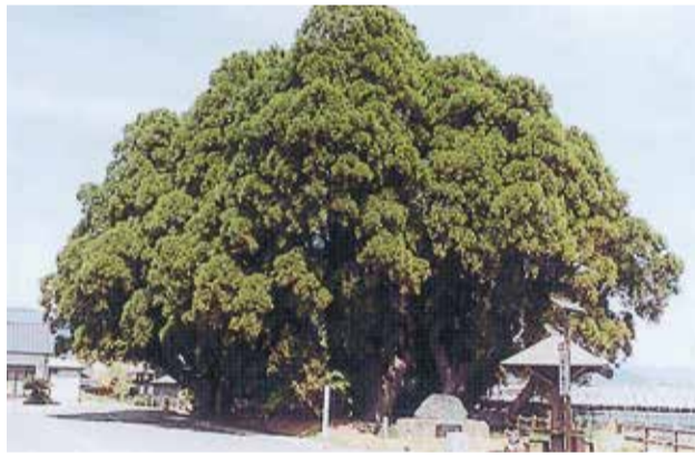
8 a 木崎原古戦場跡