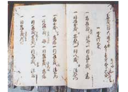
34 池島村御検地竿次帳