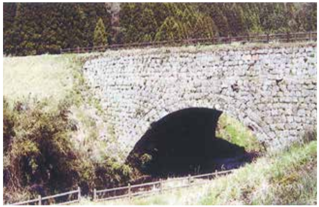
42 享保水路 太鼓橋