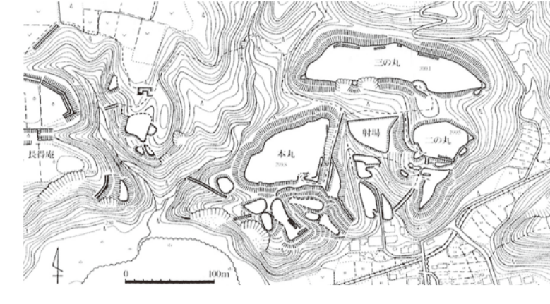
18 飯野城跡 縄張り図