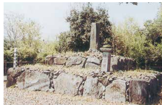
8 f 元巢塚