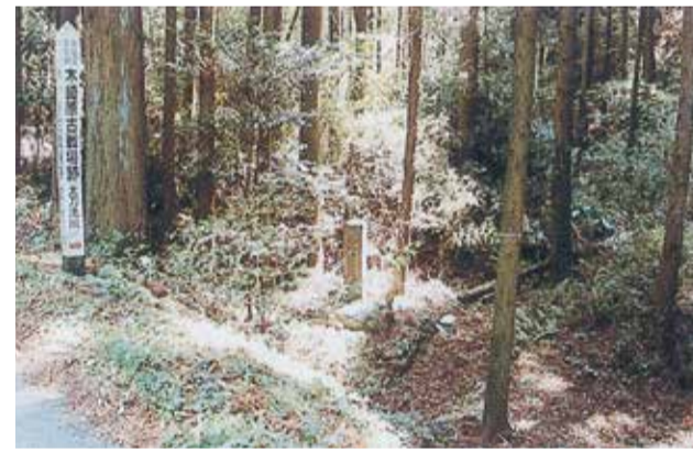
8 d 大刀洗川