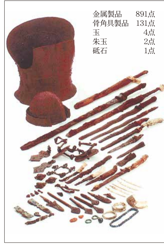
4 島内地下式横穴墓群出土品