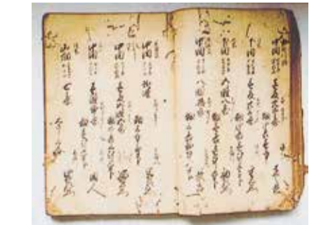
33 前田村御検地竿次帳