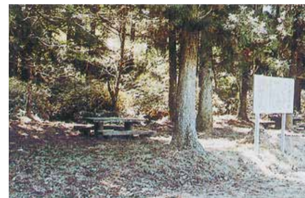
16 満足寺跡 庭園池 (左中央)