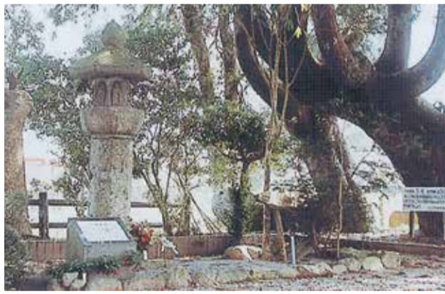
8 b 六地藏塔