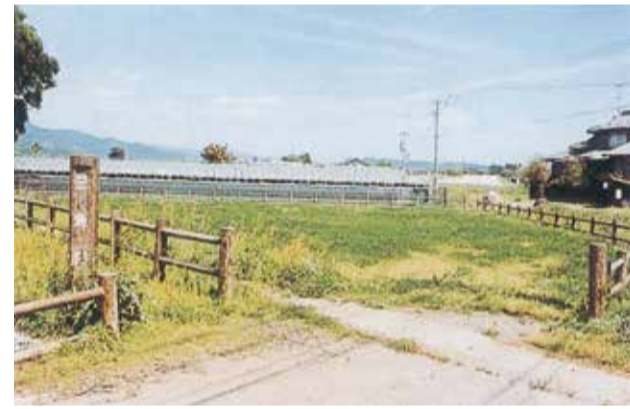
8 c 三角田