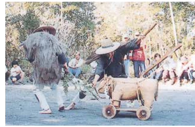
12 香取神社・天宮神社打植祭