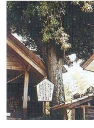
22 香取神社なぎ大樹