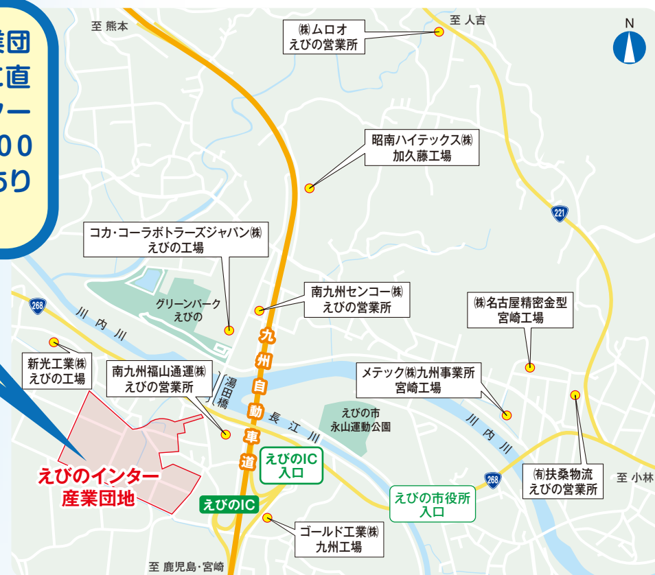
産業団地近隣見取図

えびのインター産業団地は、国道268号に直結し、えびのインターチェンジから約500メートルの位置にあります。