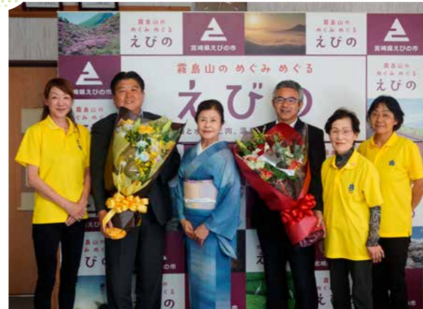
日頃の感謝を込めて

えびの市地域婦人連絡協議会の代表4人が、6月18日の父の日に合わせ、市長と教育長に花束を贈呈しました。これは、同協議会が市長と教育長をえびの市のお父さんに見立て、昭和49年から行っているものです。