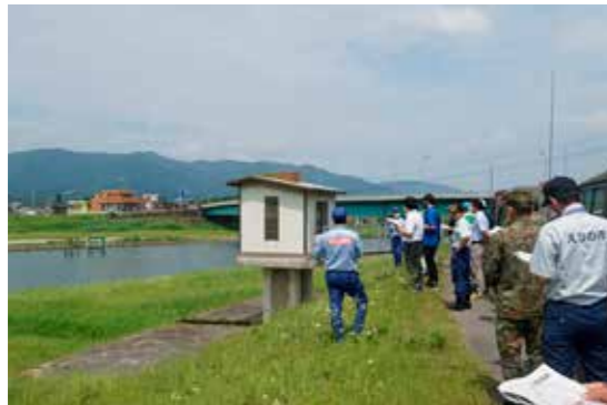
川内川の水防箇所を視察