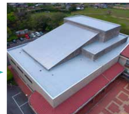
市文化センター屋上（防水工事後）