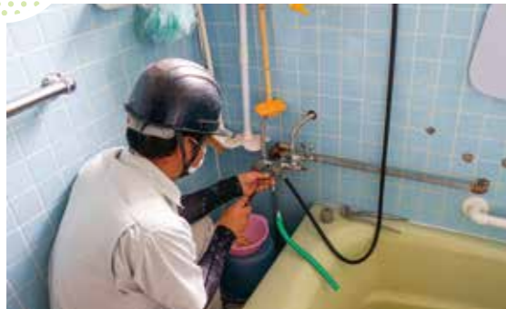
水道週間に合わせて

えびの市管工事組合の組合員が、ボランティアで高齢者宅の水道点検を行いました。これは、6月1日から7日までの「水道週間」に合わせて、高齢者が安心して暮らせるようにと行っているものです。