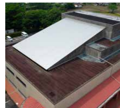
市文化センター屋上（着工前）