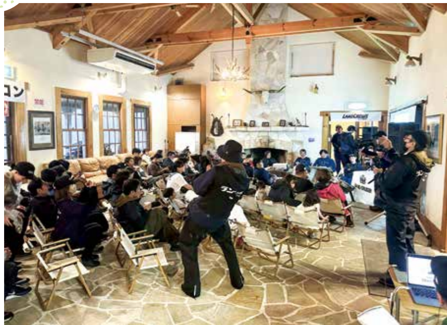
全国初のイベント実施

矢岳高原ベルトンオートキャンプ場で「ランクル絶景キャンプ『ランクルズ』」が行われました。これは、トヨタ自動車株式会社が実施したもので、全国で初めて行われたイベントです。 イベントには、市内外から45組約130人が参加しました。 イベントでは、ランクルの展示や愛車自慢、アウトドア体験、ゲストを招いてのランクルに関するトークイベントなどが行われました。