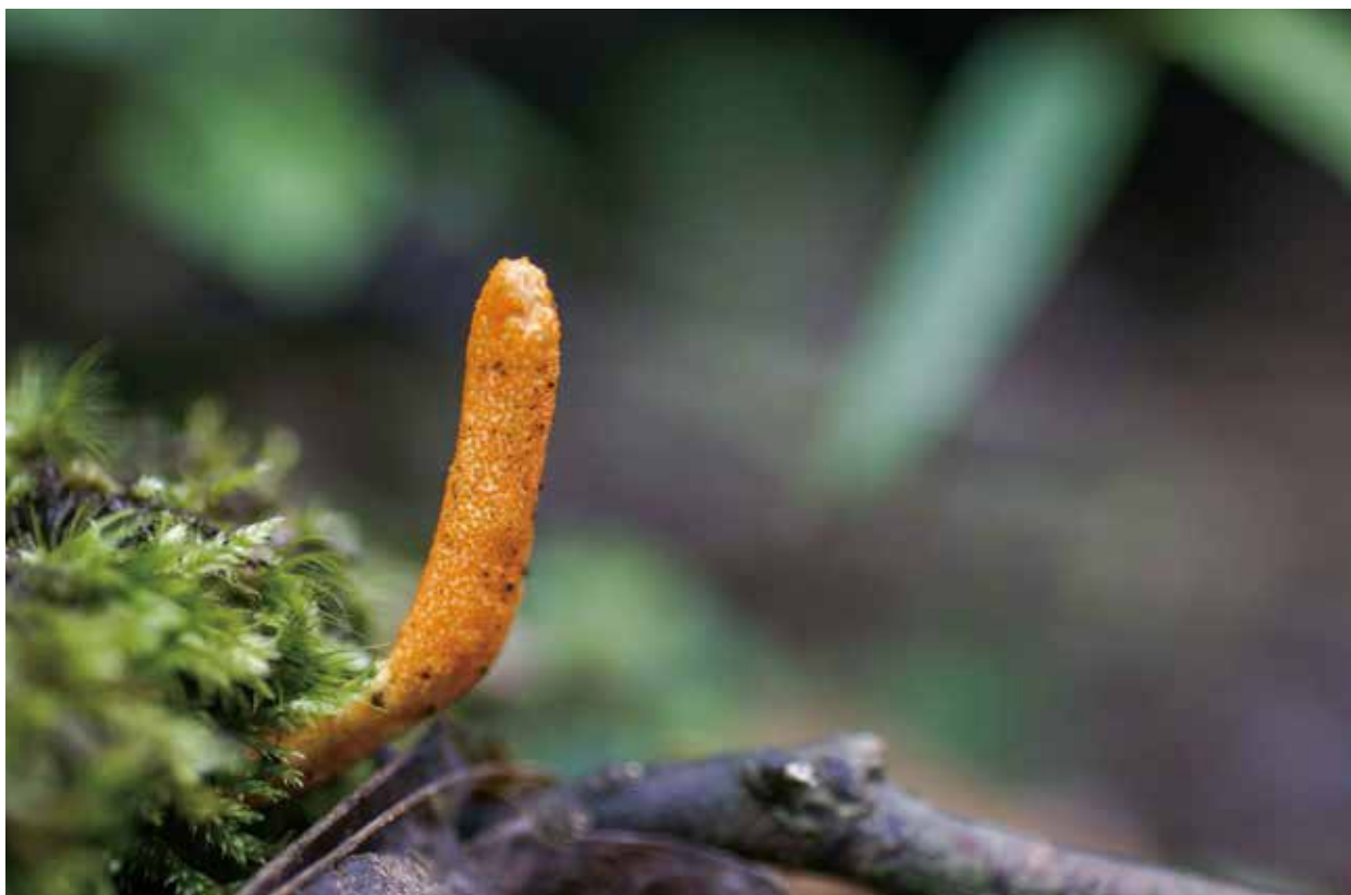
写真:コケの隙間から姿を現したサナギタケ(撮影:令和3年6月19日)