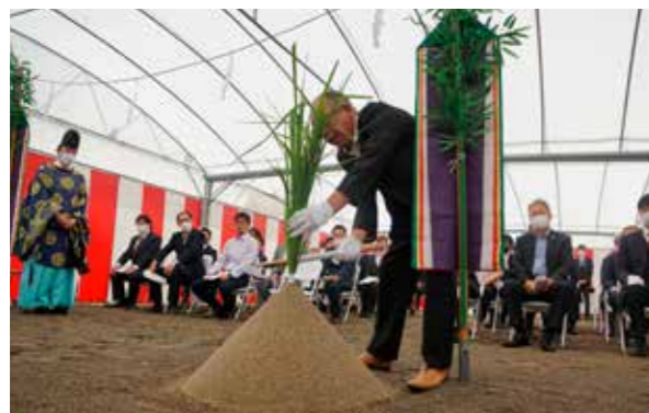
株式会社一心商事本社工場新築工事起工式