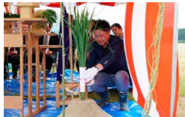
マルゼングループ協同組合えびの物流センター地鎮祭