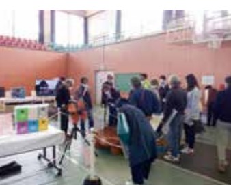
令和4年11月に小林市で実施

納付しないと滞納処分の対象に 令和4年度の市税の収納率は98.75%(現年度課税分)でした。国民健康保険税の収納率は、95.41%(現年度課税分)でした。 市では、収入や財産がありながら市税を納付しない滞納者に対して、滞納額の大小にかかわらず、滞納処分(差押え等)を行っています。 滞納が発生すると、貴重な税金を督促状の送付など、本来使わなくてよい経費に使うことになり、市民の皆さんにとって不利益になります。 そして何よりも、法律に従って自分が納めるべき税金について理解し、納期限内にきちんと納めている多くの