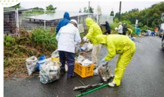
飯野地区をきれいに

飯野まちづくり協議会が、藤坂付近で美化清掃活動を行いました。これは、飯野地区をきれいにしようと、毎年場所を決めて美化清掃活動を行う新しい取り組みです。清掃活動には、同協議会の25団体が参加し、茂みの中のごみ拾いや草刈り、木の撤去などを行いました。