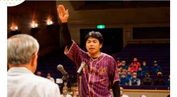
戦い抜くことを誓う

市文化センターで「みやぎ県民総合スポーツ祭えびの市選手団結団式」が行われました。同スポーツ祭は、5月28日から9月14日の期間で宮崎市を中心に行われ、えびの市からは、16競技、223人が参加する予定です。