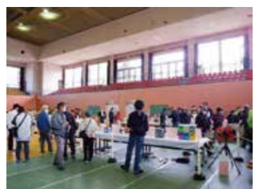
合同で公売会に取り組んでいます

の人の公平性が、滞納によって損なわれることは絶対にあつてはなりません。 預貯金・給与の差押えのほか、搜索で動産等(家財等)の差押えも行っています。差し押さえた動産等は公売を行い、公売で得た売却代金を滞納税に充てています。 令和5年度も宮崎県・小林市・高原町・えびの市で相互併任協定を結び、合同で滞納処分を行い、公売会に取り組み予定です。