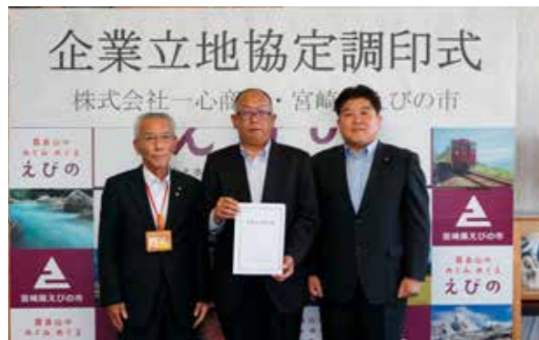
株式会社一心商事企業立地協定調印式