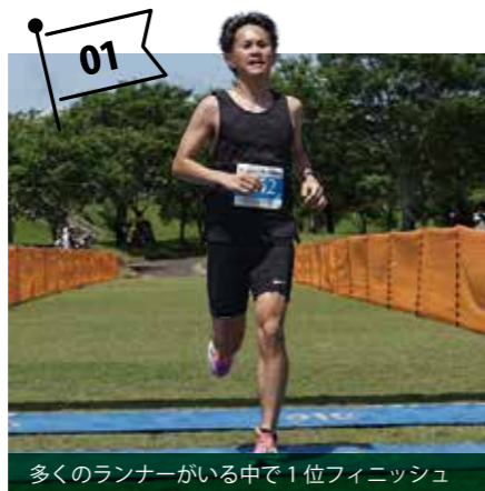
多くのランナーがいる中で1位フィニッシュ