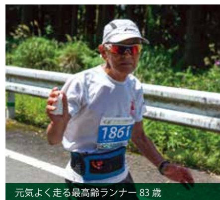
元気に走る最高齢ランナー 83歳