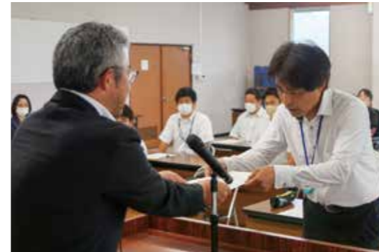
各研究員・委員に委嘱状が交付されました