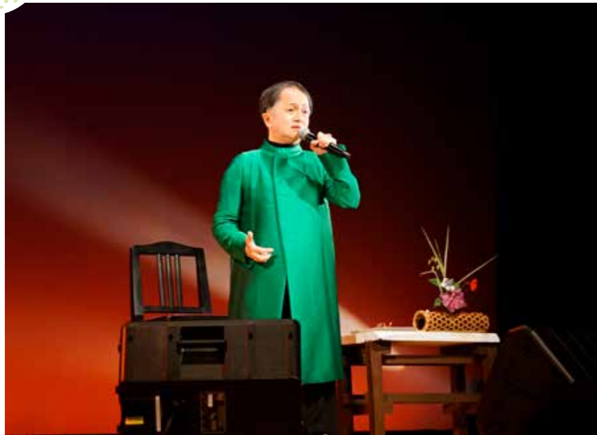
歌声とトークで観客を笑顔に

市文化センターで「第13回文化フェスティバル」が行われました。会場には、市内外から約500人が訪れました。