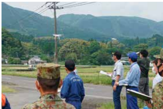
災害が起きる恐れのある場所をドローンを使って調査

5月22日、市内で「令和5年度災害危険箇所調査・点検」を実施しました。 これは、災害発生時の未然防止や被害の拡大を防止するため、危険性のある場所をあらかじめ調査し、実態を把握するために毎年行っているものです。調査には、消防署や警察、自衛隊、消防団、国、県、市の職員、自治会など、30人が参加しました。 今回は、国土交通省川内川河川