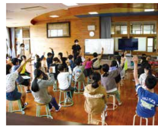
令和4年6月に加久藤小学校で行われた租税教室

滞納には延滞金が発生します 税金を納期限までに納めなかった場合は、本税のほかに延滞金が発生します。延滞金の割合は、銀行などの預金金利よりはるかに高い率です。令和5年の延滞金の割合は、納期限の翌日から1カ月を経過するまでは、1日当たり2.4%、経過した後は、1日当たり8.7%です。