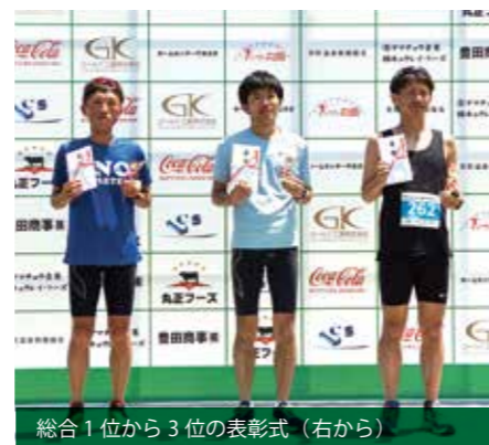
総合1位から3位の表彰式 (右から)

5月21日、グリーンパークえびのをメイン会場に「第35回えびの京町温泉マラソン大会」が行われました。