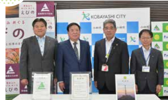
教育振興への寄附に感謝

小林市役所で、株式会社ミヤザキに対する感謝状贈呈式が行われました。これは、株式会社ミヤザキが教育振興を目的に、西諸地域の小・中学校36校に300万円ずつ寄付したことに対して、感謝状を贈呈したものです。寄付金は、学校の備品等の整備に活用されます。