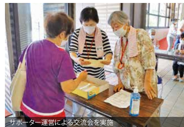
サポーター運営による交流会を実施