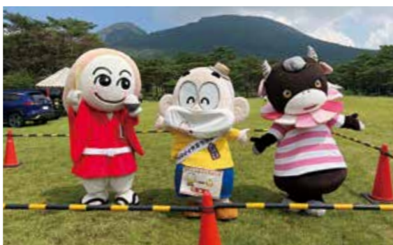
えびの高原周辺のマスコットキャラクター

えびの市認知度向上の活動を続けます! 山の日イベントを実施し、たくさんの方に来場いただきました。「宮崎大好きポケモンナッシー」にも初めてえびの市に来てもらいました。えびの高原周辺のマスコットキャラクターとの写真撮影も行いました。えびの市の皆さんもなかなかえびの高原に足を運ぶ機会がないと聞いていたので、今回のイベントがえびの高原を知るきっかけになったのであればうれしいです。また、えびの市を知ってもら