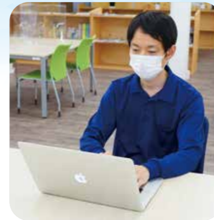
ホームページを作成や保守作業を行います

元々、イービックに常駐しているマネージャーを知っていて、その縁があったので、起業支援センター(以下、イービックという)の存在を知りました。すでに事業は始めていましたが、法人の立ち上げについてマネージャーに相談して利用を開始しました。自宅ではなく、仕事に集中できるスペースが欲しいと思っていたことも利用のきっかけです。 今はイービックを卒業して、自分で事業を進めています。利用していたときは、24時間使えるオフィススペースがとても便利でしたし、事業仲間がいることがとても心強かったです。