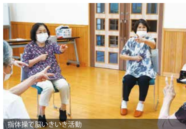
指体操で脳いきいき活動

皆さんは、はつらつサポーターをご存じですか？平成26年から実施されている自治会主体の百歳体操は、今では市内全域まで広がっています。百歳体操を実施するためには、はつらつサポーターの存在は不可欠です。今回の特集では、はつらつサポーターの活動などを紹介します。