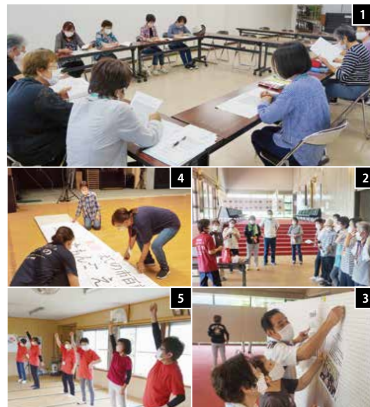
1 役員会議で当日の内容や当日までの準備について協議を行いました 2 実行委員会で受付やステージ、ロビーの展示など、本番に向けて担当に分かれて準備を行いました 3 ロビーには各会場の百歳体操の様子を紹介するパネルを展示。実行委員で手分けして設置作業を行いました 4 ステージ上の看板の貼り付け作業を行いました 5 当日紹介するリズム体操を事前に練習しました