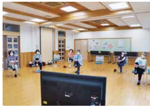
サポーターが会場設営などを行い、参加者と一緒に百歳体操を行います