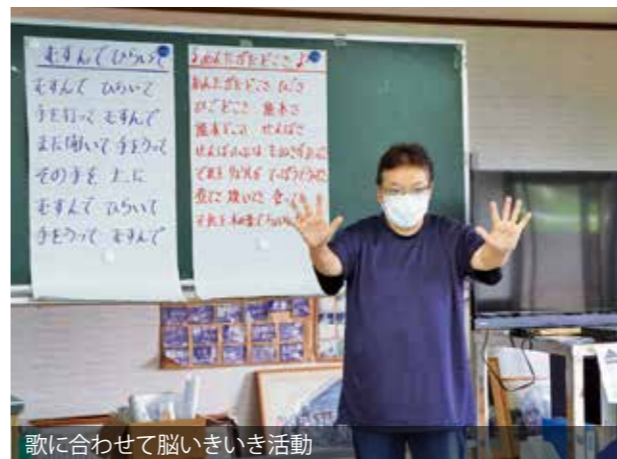
歌に合わせて脳いきいき活動