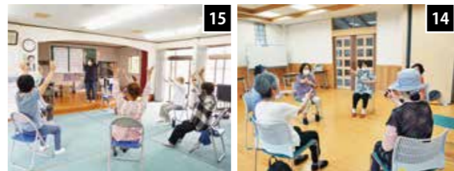
13 えびの音頭に合わせてみんなで踊ります(町) 14 手指を動かして脳を活性化させます 15 歌を歌いながら手指を動かします(北岡松)