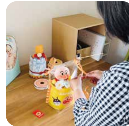
おむつケーキをインターネット販売しています

イービックは、個人で事業をする私にとって、とても使いやすく、仲間と情報共有しながら仕事ができるとても良い環境でした。悩んでいる人は、気軽に相談してみてください。マネージャーが親身になってサポートしてくれます。