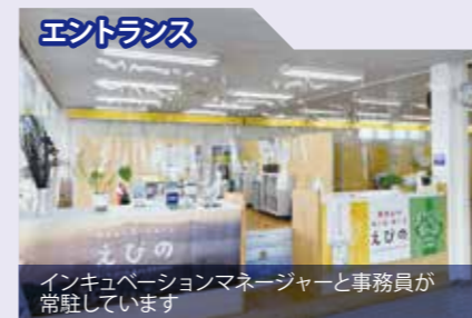
イベントスペース

また、事業をする中でのトラブルなども、マネージャーに関係機関などを紹介してもらって助けていただきました。現在は、ホームページの作成等を行っていて、イービックのホームページ作成もしています。また、妻と一緒におむつケーキの販売も行っています。