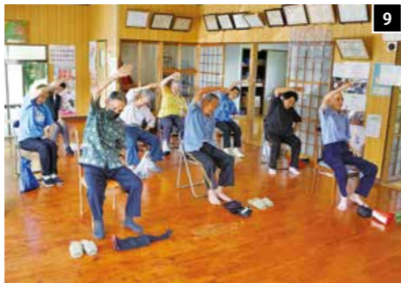
9 百歳体操前の準備体操。しっかり体を伸ばします(出水) 10 筋力アップのためにおもりをつけて体操をします