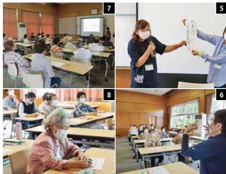
5 サポーター役員が脳活性化につながる高齢者川柳を紹介 6 サポーター役員が指体操などの脳いきいき活動を紹介します 7 市介護保険課による認知症に関する講話 8 熱心にメモを取りながら講話を聞きます