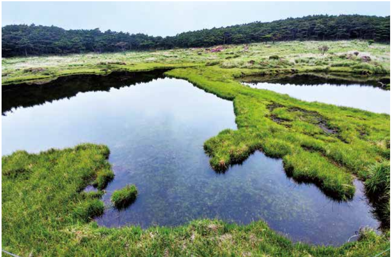
写真：甑岳火口内湿原(撮影：令和4年8月27日)