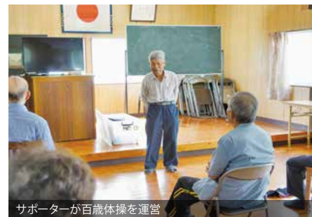
サポーターが百歳体操を運営