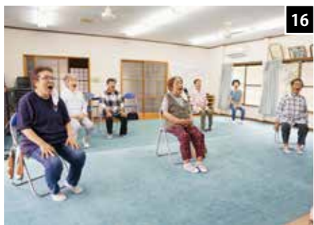
16 かみかみ百歳体操のDVDを見ながら口周りを動かして、食べる力・飲み込む力をつけます(北岡松)