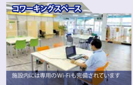
コワーキングスペース