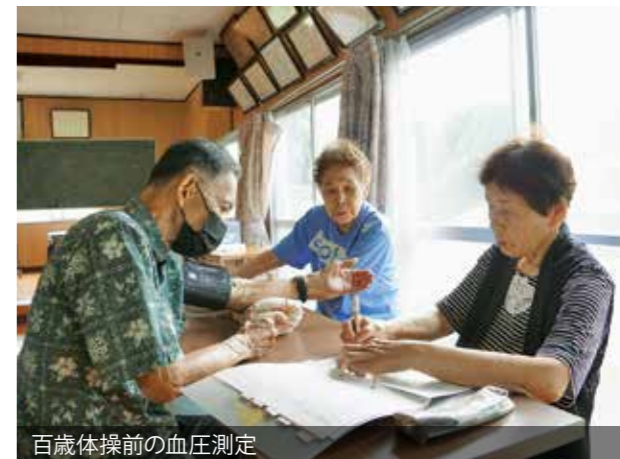
百歳体操前の血圧測定