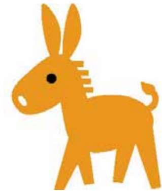
認知症サポーターマスコット「ロバ隊長」