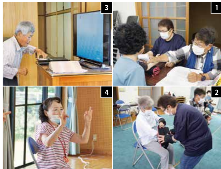
1 百歳体操を行う前に参加者の血圧測定や検温を行います 2 おもりをつけるときなど参加者をサポートします 3 百歳体操のDVDの準備や操作をします 4 脳いきいき活動で指体操などをリードします