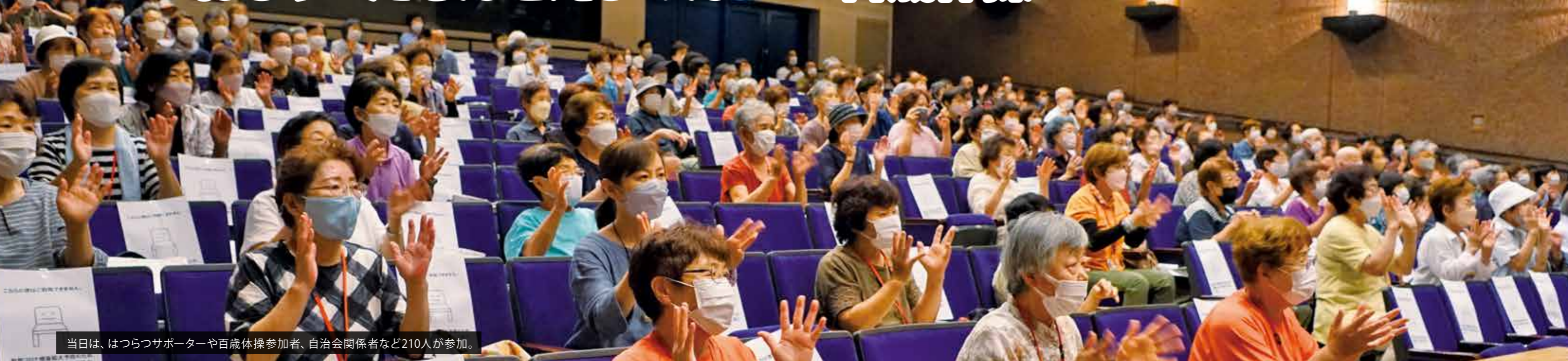
当日は、はつらつサポーターや百歳体操参加者、自治会関係者など210人が参加。

7月29日、市文化センターで「第2回百歳体操交流会おじゃったもんせえびのん百歳体操」が行われました。これは、はつらつサポーター連絡会が市と協力して実施したものです。