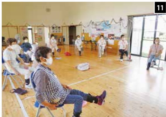
11 足におもりをつけて体操をします(東川北) 12 百歳体操はDVDを見ながら実施します