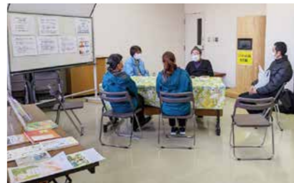
オレンジカフェよかとこを実施しています