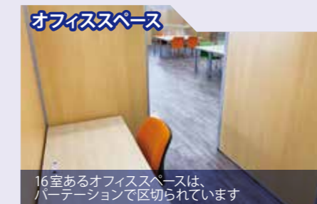
オフィススペース