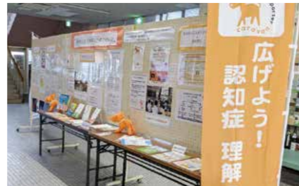
認知症に関するパネル等を展示しています

話でお申し込みください。 認知症サポーター 認知症を正しく理解し、認知症の人や家族を温かく見守る「応援者」です。市では、認知症サポーター養成講座を、自治会、職場、学校、サロンなど、さまざまな場所で開催しています。開催を希望する場合は、市介護保険課にご相談ください。