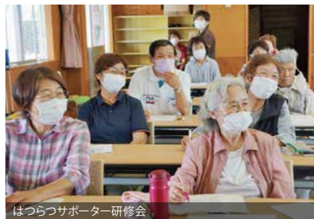
はつらつサポーター研修会