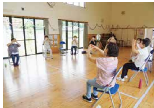
サポーターが養成講座などで学んだ脳いきいき活動を実施します

はつらつサポーターは、自治公民館等で行われている百歳体操の運営をボランティアで行っています。始まりは平成26年。初めての養成講座が開催され、29人が受講し、はつらつサポーター1期生として認定を受けました。1期生の認定とともに、はつらつサポーター連絡会が発足しました。 百歳体操開始初年度は、7自治会9会場での実施、274人の参加でしたが、現在では、58自治会62会場で実施され、835人が参加しています。そのうち、315人がはつら