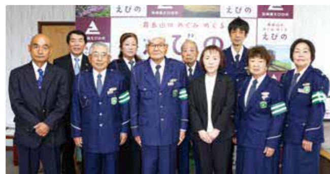
委嘱状交付式には9人が出席しました