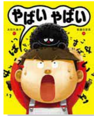
やばいやばい 太田久美子 作・絵 佐藤日登美文 (ポプラ社)