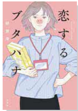
恋するブタハナ 額賀澤 著 (双葉社)