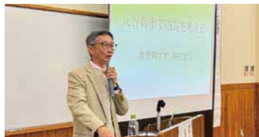
「えびの市で防災を考える」をテーマに講演