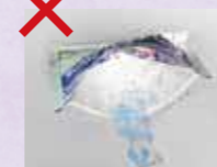
外袋の中は空の状態に出しましょう