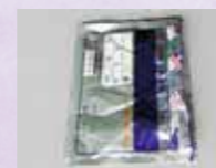
プラマークがある外袋は「プラスチック製容器包装」