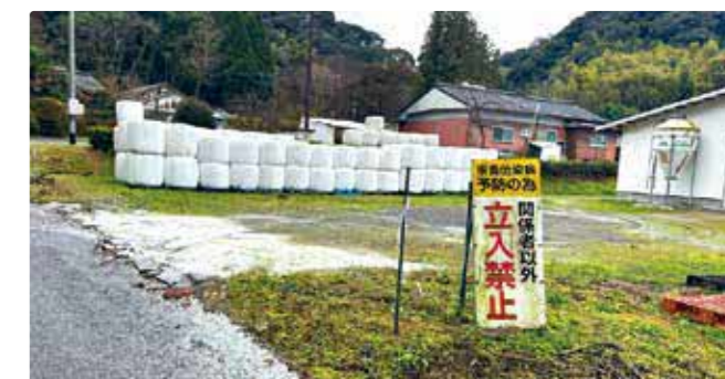
消石灰の散布等、家畜を守るために防疫体制を整えましょう

てもおかしくない状況です。大切な畜産を守るため、飼養衛生管理基準の遵守と農場防疫の再確認を徹底し、二度とあのような悲劇を繰り返さないよう、一人一人が強い意識を持って取り組みましょう。