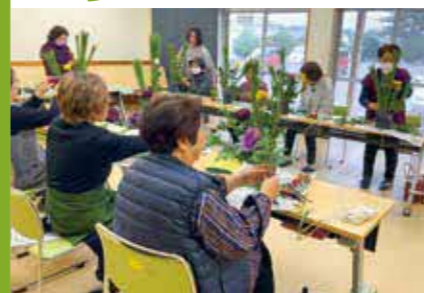
「お正月飾り」制作の様子