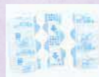
フィルム部分は「燃やせるごみ」で出しましょう

※湿布の外袋の中は、空の状態です。プラスチック製容器包装の指定袋に入れてください。