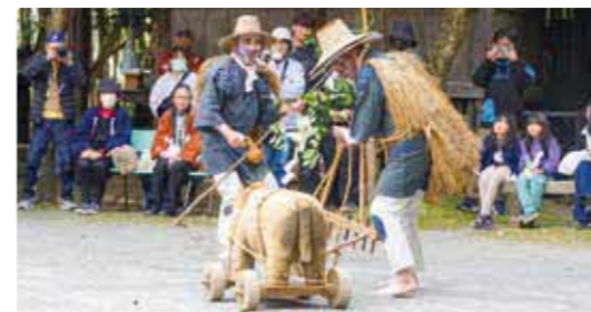
両神社の神事の後に行われた狂言回し

今西地区の香取神社と田代地区の天宮神社で「打植祭」が行われました。この祭りは、香取神社の女神が天宮神社の男神を迎えに行くという神話をもとに、地区の人たちが、両神社を歩き来し、神事などを行い、豊作を祈願するものです。宮崎県の無形民俗文化財に指定されています。