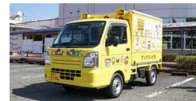
更新されたブックランド号