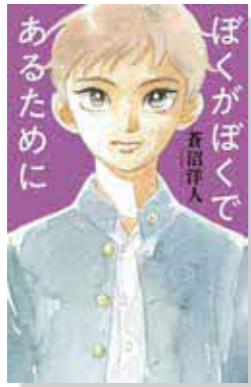
ぼくがぼくであるために 蒼沼洋人 作 (ポプラ社)