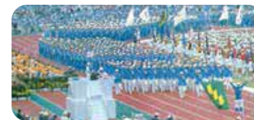
1979年大会開会式の様子