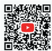
YouTube あさぼチャンネル

信じていますので、気になった人は、ぜひ、のぞいてみてください。秋頃には、工場が本格稼働できるように頑張っていますので、お気軽に茶のんばあ感覚で、お店にも遊びに来てください。