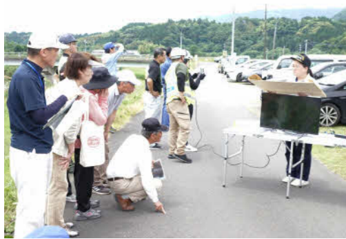
ドローンを用いて災害警戒区域箇所を確認

5月24日、市内で「令和6年度災害警戒区域調査・点検」を実施しました。 これは、災害発生の未然防止や被害の拡大を防止するため、危険性のある場所をあらかじめ調査し、実態を把握するために毎年行っているものです。調査には、消防署や警察、消防団、国、県、市の職員、自治会など、32人が参加しました。 国土交通省川内川河川事務所が主催する「川内川水防箇所合同巡視」と合わせての実施となり、川