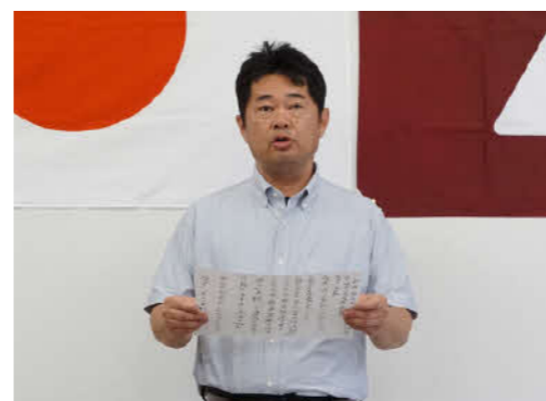
川野教頭が誓いのことばを述べました

5月21日、市役所で「令和6年度えびの市教育研究センター研究員および学力向上研究委員委嘱状交付式」が行われました。 これは、教職員の資質向上を図り、児童生徒の学力向上に資することや、教職員へ今後の教育活動に対するさらなる意欲の喚起を行うことで、本市の教育の充実を図るために行っているものです。 令和6年度は、「教育研究センター研究員」として小学校教員5人、中学校教員4人、「学力向上研究委員」として小学校教員6人、