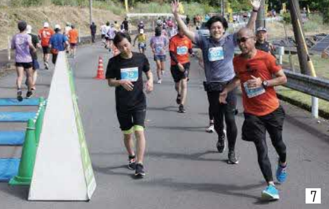
10 ウォーターミストで癒される 11 すれ違いざまに声を掛け合う 12 笑顔で下り坂を駆け抜ける 13 約6km地点を疾走するランナー 14 笑顔で走るランナー 15 懸命に走るランナー（約18km地点） 16 笑顔で仲良くゴール 17 振る舞われたカレーを食べるランナー 18 ハーフの総合1位から3位の表彰式（左から） 19 仲間とともに喜びを分かち合う 20 おそろいのウェアで記念撮影