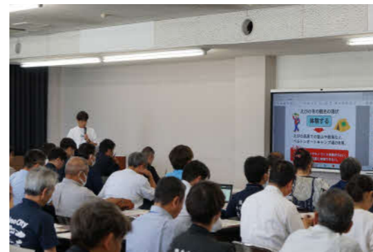
観光振興を行ってきた団体の活動報告が行われました