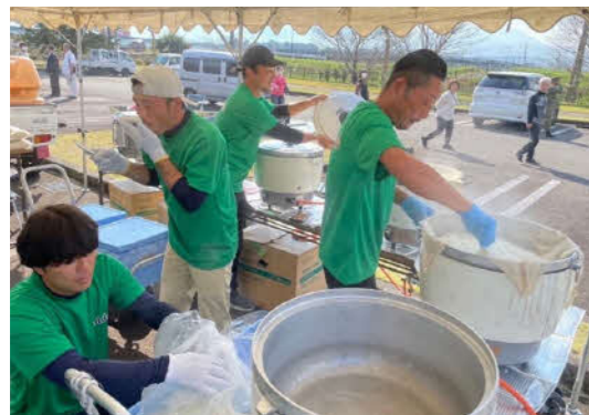
オコメクエストでえびの産ヒノヒカリをPR (Yaddo)