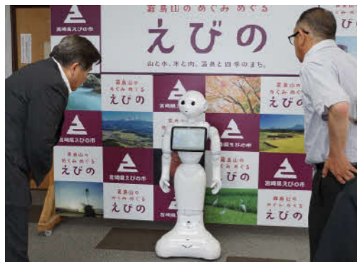
ペッパーがこれまでのプログラミング教育の成果を報告