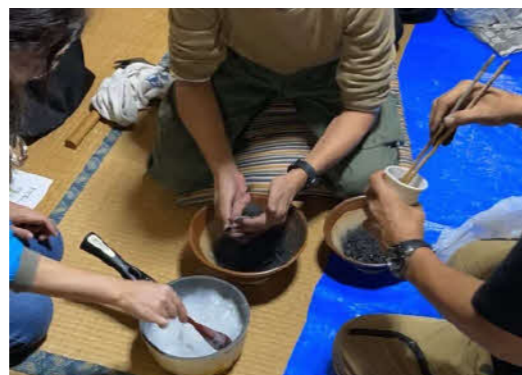
竹炭ボール製作のワークショップを開催 (ZEROHO)

【ぶらいど21助成金とは】 21世紀を迎え、私たち市民が市内にある歴史や文化、産業をしっかりと見つめ、誇りと自信を持って、いきいきとしたまちづくりを進めるために、予算で定める額を上限として、その活動を行う市民団体に助成金を交付するものです。 ※ぶらいど21助成金の詳しい内容については、市民協働課までお問い合わせください。