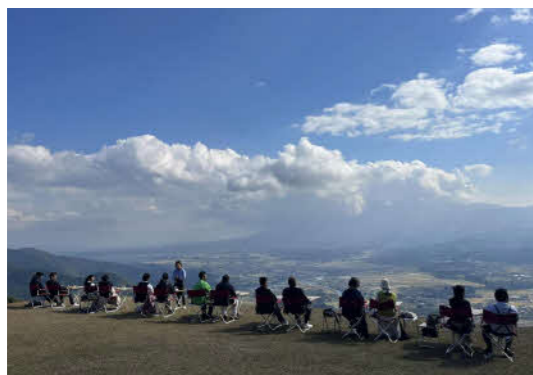
食と農を繋げる屋外レストラン (ライトえびの)