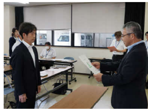
各研究員・委員に委嘱状が交付されました