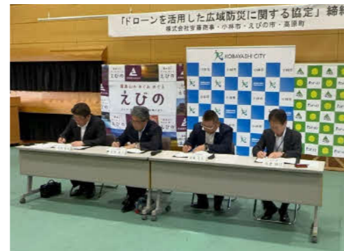
協定書に署名しました