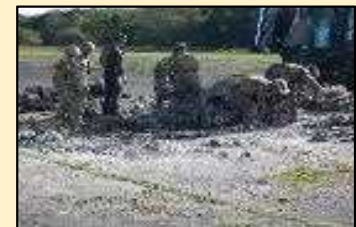
日米による滑走路復旧訓練