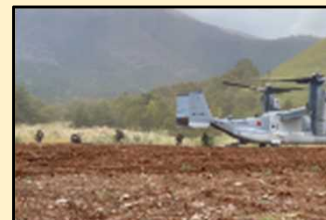
日米オスプレイ等による空中機動訓練