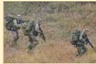
対着上陸戦闘訓練